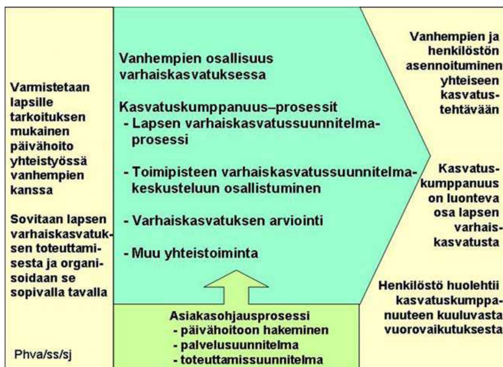
KUVIO 3. Vanhempien osallisuus varhaiskasvatuksessa (Helsingin varhaiskasvatussuunnitelma 2007).

Kasvattajan ammatillinen ymmärrys lapsen arjesta ja toisaalta vanhempien syvälinen tuntemus lapsesta, muodostavat yhdessä tärkeän kokonaisuuden. Usein vanhemmat kokevat, että luottamuksellinen suhde päivähoitoon ja päivähoidon henkilökuntaan rakentuu siitä, miten kasvattajat kertovat lapsesta vanhemmille. Kasvatuskeskusteluissa kasvattaja kuvailee lapsen arkea omien havaintojensa pohjalta ja ottaa esiin mahdolliset huolenaiheet. (Kaskela - Kekkonen 2006: 44–48.) Helsingin varhaiskasvatussuunnitelmassa 2007 määriteltiin vanhempien asemaa varhaiskasvatuspalvelujen asiakkaana seuraavalla kuviolla.