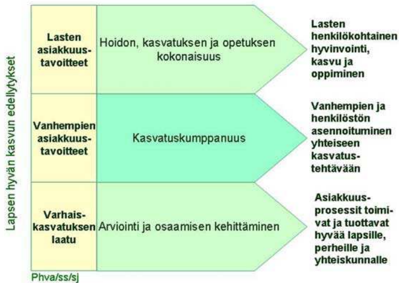
KUVIO 1. Päivähoidon ja varhaiskasvatuksen prosessit (Helsingin varhaiskasvatussuunnitelma 2007).