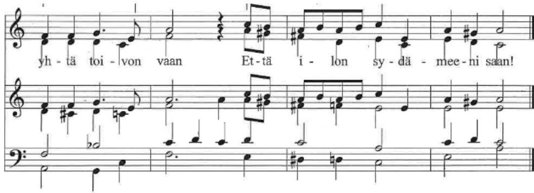
KUVA 13. Osa 2, Taivaan isäni on asia nyt niin. Lasten kirkko (Ainali 2007)

synnintunnustuslaulu Taivaan isäni on asia nyt niin (kuva 13) kuvaa hyvin sitä nöyrää tunnelmaa, joka yleensä liitetään jumalanpalveluksen synnintunnustusosioon. Laulun lopussa lauletaan ”Pyydän anteeksi ja yhtä toivon vaan, että ilon sydämeeni saan!”. Tässä Ainali on kuvannut sydämeen toivottavaa iloa melodiassa esiintyvillä nopeammilla 8-osa nuoteilla.