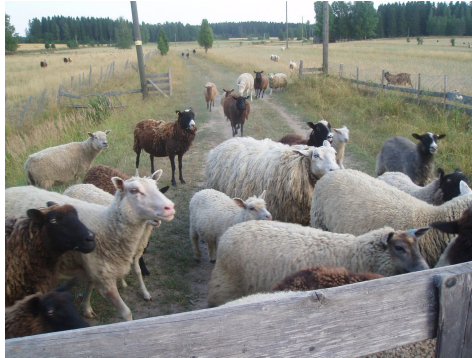
Kuva 2: Erivärisiä uuhia

tuotantoon keskittyvät tilat eivät ehdi tai osaa panostaa villan käsittelyyn ja siksin villa on usein roskaista ja takkuista.