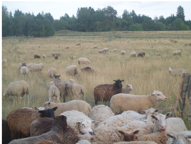
Kuva 5: Seppo Villan lampaista tilan laitumella

Lampaiden nahat on mahdollista ostaa takaisin siitä erikseen etukäteen teurastamon kanssa sopimalla. Lampurin ei tarvitse itse suolata nahkoja vaan teurastamo tekee sen. Joissakin tapauksissa voi sopia nahkojen suorasta kuljettamisesta teurastamolta muokkaamolle. Muutoin lampuri hakee itse nahat teurastamolta ja vie ne muokkaamolle. Lampurit käyttävät useimmiten kotimaisia muokkaamoita, mutta myös ulkomaisia, kuten ruotsalaisia, käytetään. Muokatut nahat markkinoidaan lähinnä kokonaisina joko koristekäyttöön tai lasten vaunuihin ja pulkkiin lämmikkeeksi. Parhaita nahkoja käytetään vaatteiden esim. liivien, hattujen ja turkisten tekoon. Suomenlampaan nahka soveltuu käsitöihin paremmin kuin liharotuisten nahat notkeutensa ja ohuutensa ansiosta. Suomessa olevat teollisuusyritykset eivät käytä kotimaisia lampaannahkoja, koska käyttöä vaikeuttavat voitukset, joita aiheuttavat ulkoloiset. (Äärilä & Harmoinen 2007, 87.)