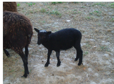
Kuva 4: Terve karitsa Villan tilalta

Lallin Lammas Oy:n päätökseen siirtyä kasvattamaan ostettuja karitsoita eikä pitää omia uuhia vaikutti susivahinkojen suuruus kesän 2008 aikana sekä sen vaikutus uuhien pitoon. Monien pienten luonnonlaitumien alittaminen sähköaidoilla on kallista. Lisäksi etuina ostokaritsoiden kasvatuksessa on se, että niiden hoitaminen voidaan tehdä lähinnä palkkatyvoimalla, eikä osakkaiden tarvitse enää valvoa kyl-