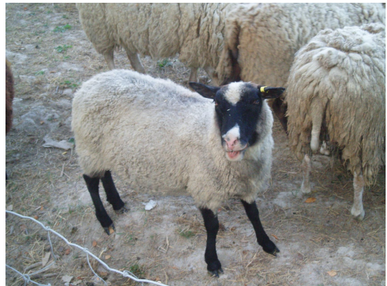
Kuva 1: Kainuunharma Villan tilalta

Rotu tulee aikaisin sukukypsäksi ja sen siikiävyys on erinomainen. Sitä käytetäänkin paljon emona risteytyksissä rodun hedelmällisyyden takia. Suomeen on tuotu ulkomailta lihantuotantorotuja, jotka ovat Texel, Oxford down, Dorset ja Rygja. Niillä on hyvä kasvunopeus ja lihakkuus. Villa on karkeampaa kuin Suomenlampaalla. Risteytystuotannossa liharotuja käytetään yleensä isärotuna. Suomessa on myös muutamaa muuta tuontirotua esim. Ahvenanmaalla yhdellä tilalla on itä-friisiläisiä maitolampaita joitakin yksilöitä. (Äärilä & Harmoinen 2007, 29-31.)