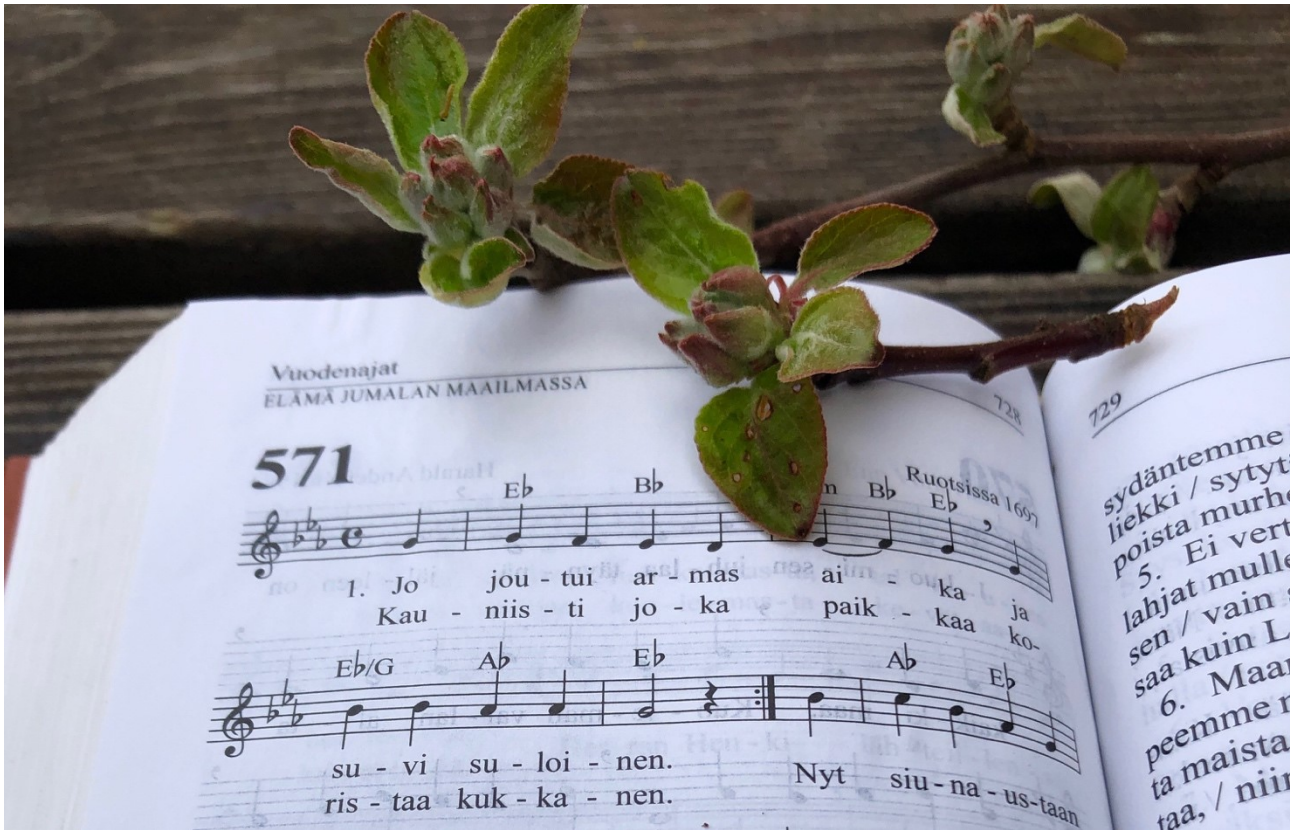
KUVA 1. Suvivirsi on ollut 1800-luvulta asti osa Suomen kevätjuhlaperinnettä