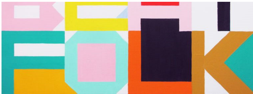
Toni Hautamäki, JAZZBEATFOLK, öljy/kangas/mdf, 75 cm X 100 cm, 2018.

AT: Ihmiset palavat loppuun. Sanotaan vaikka, että kuolee nuorena, ura jää kesken. Yhdessä vaiheessa taiteilijuuteen "vaadittiin", että piti olla puolihullu, tai kokohullu!