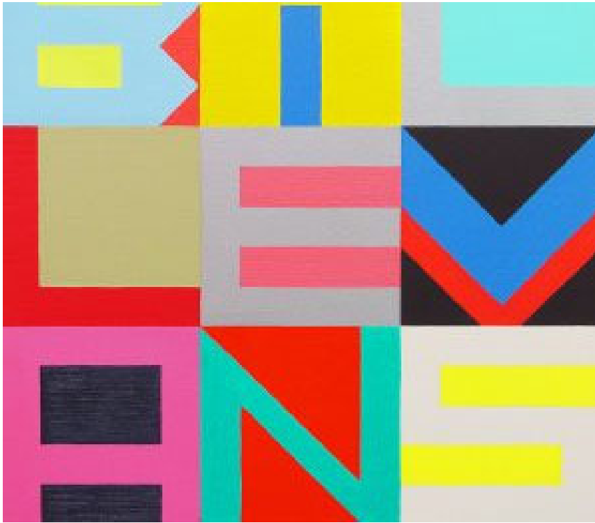
Toni Hautamäki, BILLEVANS, öljy/kangas/mdf, 75cm x 75 cm, 2018.

AT: Kun tein pedagogiset opinnot, niin aika paljon tein hommia siinä, että mitä on kuvataiteilijan osaaminen.