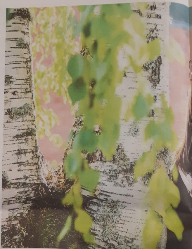
– Haastateltavat olivat vähän jo kylästyneet siihen, että puhutaan vain lastensuojelun huonoista puolia. He halusivat

Osalle vanhemmista oli ollut tärkeää, että sosiaalityöntekijät eivät laita menneisyyden vaikeuksille kohtuuttomasti painoarvoa vaan keskittyvät siihen,