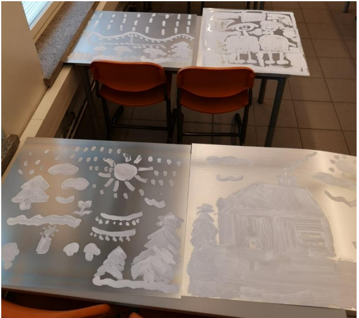
KUVA 3. Valmistuneet laatat.

sessi ja taiteellinen työskentely vielä yhdessä keskustellen. Viimeisen tapaamisen aikana käydyssä keskustelussa kävi ilmi, että ohjattava koki valikoituneet aiheet edelleenkin hyvin tärkeiksi. Tämän lisäksi hän koki tekevänsä jollain lailla ”kunniaa” tehdessään niistä taideteokset. Alkuperäisenä tavoitteena oli prosessin kautta mahdollistaa ohjattavalle voimavaraistava kokemus. Tämän palautteen myötä koin että saavutimme sen.