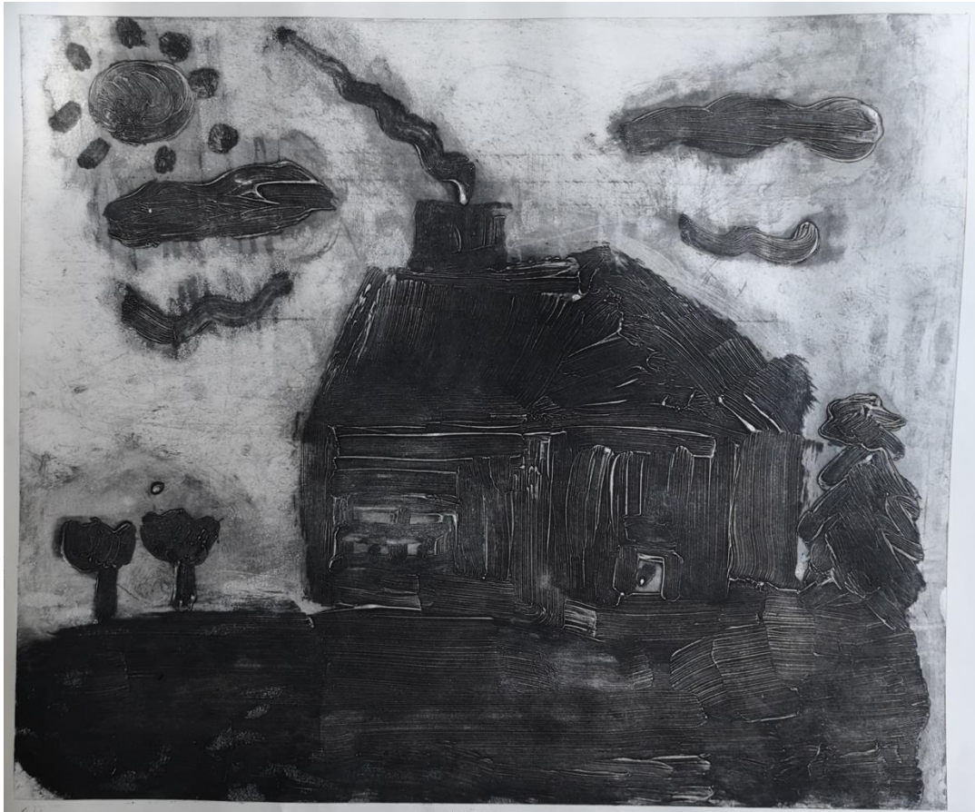
LIITE 4. Hyvä koti, 2019, Carborundum, 1/1