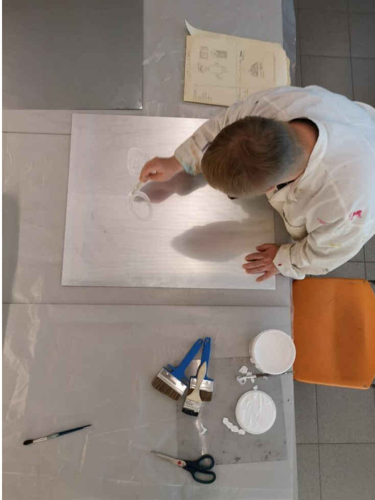
KUVA 2. "Äiti-Maire" teoksen valmistelua.

valmista suunnitelmaa työstä, vaan ehdotin, että hän voisi vain testailla rauhassa. Monotyyppitöiden vedostamisen jälkeen lopetimme päivän työskentelyn ja lähdimme päivälliselle.