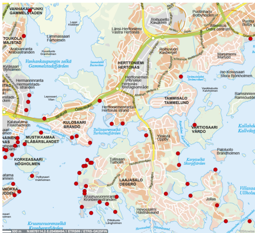
Kuva 2. Merellisten toimintojen uudet paikat (Karttapalvelu 2019)