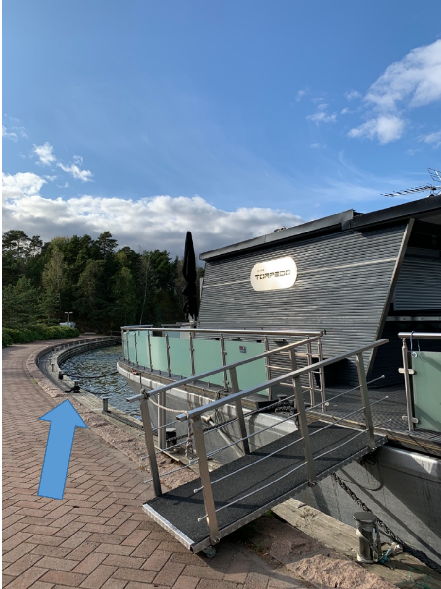
Kuva 4. Mustikkamaan parkkipaikan ranta-alue. Nuoli osoittaa kahvilalaivan taakse jäävää tyhjää tilaa rantamuurissa.

Herttoniemen Reginankujan niemen päähän olevan asuinrakennuksen rakennustöiden yhteydessä on suunnitteilla mahdollistaa myös laiturin lisääminen veneiden kiinnitystä varten. Eli kyseinen kohde olisi nähtävissä potentiaalisesti tulevaisuudessa. Kuitenkin alueella, Reginankujan toisessa päässä olevan poukaman rannasta, löytyi jo nyt toteutettavissa oleva potentiaalinen kohde veneiden lyhytaikaiselle kiinnitykselle (Kuva 5). Kiinnitysmenetelmä puuttuu vielä kohteesta, niin laiturilta kuin rantamuurista. Lisäksi tulisi lisätä merkintä syvyyksestä ja kiinnitysajasta.