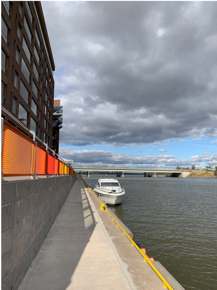
Kuva 3. Kalasatama Sörnäistenranta.

Mustikkamaan parkkipaikan ranta-alueen kohde nousi esille oikeastaan vasta dokumentoinnin yhteydessä (Kuva 4). Kohde olisi potentiaalinen jo nykyisellään, ainoastaan syväys- ja kiinnitysaikamerkintä puuttuvat. Veneiden päiväkiinnittymisen salliminen voisi tuoda pienen helpotuksen parkkipaikkaproblematiikkaan mahdollistamalla alueen saavutettavuus paremmin myös vesiteitse. Lisäksi mainittakoon, että kahvilalaiva on paremmin havaittavissa mereltä kuin maalta käsin. Joten kahvilan toiminta voisi piristyä huviveneilijöiden vierailuista.