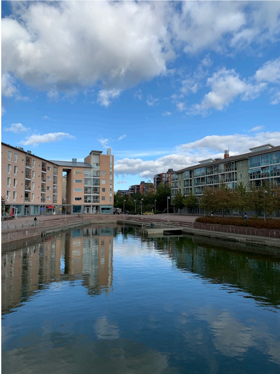
Kuva 5. Herttoniemi Reginankujan poukama.

Herttoniemen Neitojenranta oli toinen kohde, joka nousi esille vasta dokumentoinnin yhteydessä (Kuva 6). Neitojenrannan rantamuurissa on kiinnitysmenetelmä jo valmiiksi ja alueella oli yksi vene kiinnittyneenä. Alueella on jo merkintä, ettei kiinnittymistä saa tapahtua klo 22.00-07.00 välisenä aikana eli päiväkiinnitys on sallittua. Merkintä syväyksestä puuttuu, eikä kohteesta löydy mainintaa kaupungin virallisten lyhytaikaisten kiinnityspaikkojen tietokannasta.