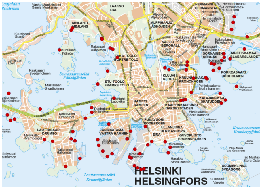
Kuva 1. Merellisten toimintojen uudet paikat (Karttapalvelu 2019)

Liite 2. Helsingin kaupungin rantareitin uusien toiminnalliset paikat, jotka pohjautuvat Hugo Leppäsyvän tekemään kartoitukseen.