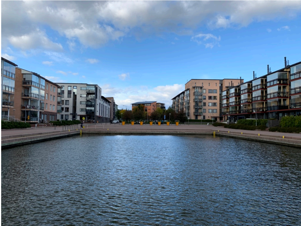
Kuva 6. Herttoniemi Neitojenranta

Dokumentoinnin yhteydessä, potentiaalisia kohteita paikan päällä tarkasteltaessa, muodostui selkeämpi käsitys kohteen potentiaalisuudesta ja etenkin siitä, miten kohteen ympäristö ja luonnontekijät voivat vaikuttaa kohteen todelliseen soveltuvuuteen ja mahdollisuuden toteuttaa turvallinen veneiden kiinnittyminen. Etenkin sään vaikutus ja sen luomat haasteet korostuivat rantojen läpikäynnin yhteydessä. Samalla eri alueiden luonne tuli koettua paikan päällä.