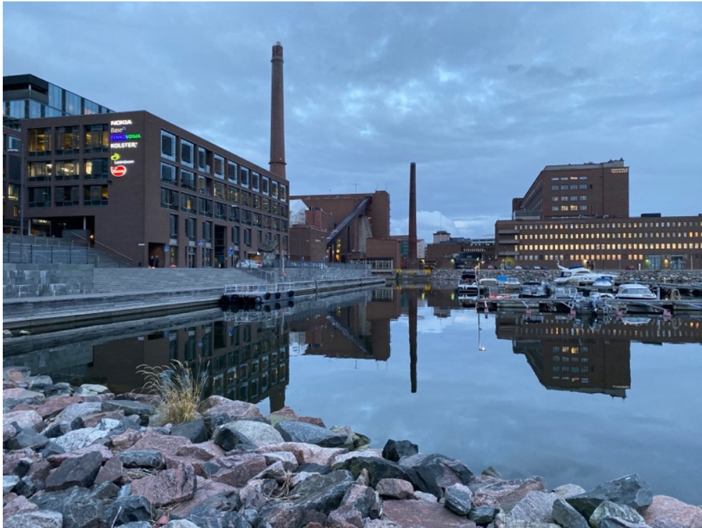
Kuva 2. Sompasaari

(Kuva 2). Kartoituksen pohjalta saatuun tietoon nojaten kyseistä rantalaituria tässä työssä ehdotettiin soveltuvaksi paikaksi veneiden lyhytaikaiselle kiinnittymiselle. Vain syväys ja kiinnitysaika merkintä puuttuu. Kohde on urbaani ja sen parempi saavutettavuus vesitse voisi lisätä alueen aktiivisuutta ja nykyisten palveluiden käyttöä sekä lisätä palveluiden ja toimintojen tarvetta.