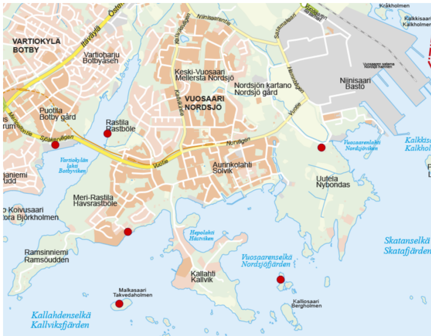
Kuva 4. Merellisten toimintojen uudet paikat (Karttapalvelu 2019)