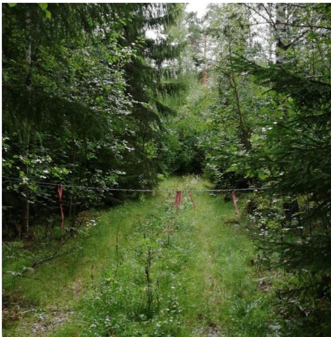
Kuva 3. Oma tie ja muilta liikkujilta rajoitettu tieosuus.

Sopimustienä voidaan pitää esimerkiksi pellolle vievää tietä tai venevalkamatietä, josta kiinteistöjen omistajat ovat yhdessä sopineet ja tehneet kirjallisen sopimuksen; myös suullinen sopimus tienkäyttöoikeudesta voidaan tehdä. Kirjallinen sopimus olisi kummin-kin molempien sopimuksen osapuolien kannalta parempi, jos tulee myöhemmin sopimuksen sisältöön liittyvää tarkentamista. Kun yksi sopimuksen osakas vaihtuu, tulee sopimustien tiesopimus uudistaa. [2, s. 9.]