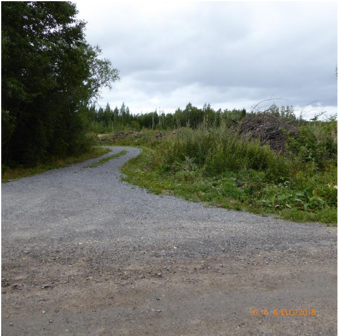
Kuva 1. Esimerkki toimitustiestä.

Kuvassa 1 oleva tie voisi olla yksityistietyyppiltään toimitustie. Kuvassa 2 on esimerkki sopimustiestä, joka vie pellolle. Kuvassa 3 on hyvä kuvaus omasta tiestä, jolle muilta liikkujilta on pyritty estämään tien käyttö. Esimerkiksi omana tienä voisi olla harvoin käytettävä kesänviettopaikalle vievä pieni tien osuus [2, s. 9].