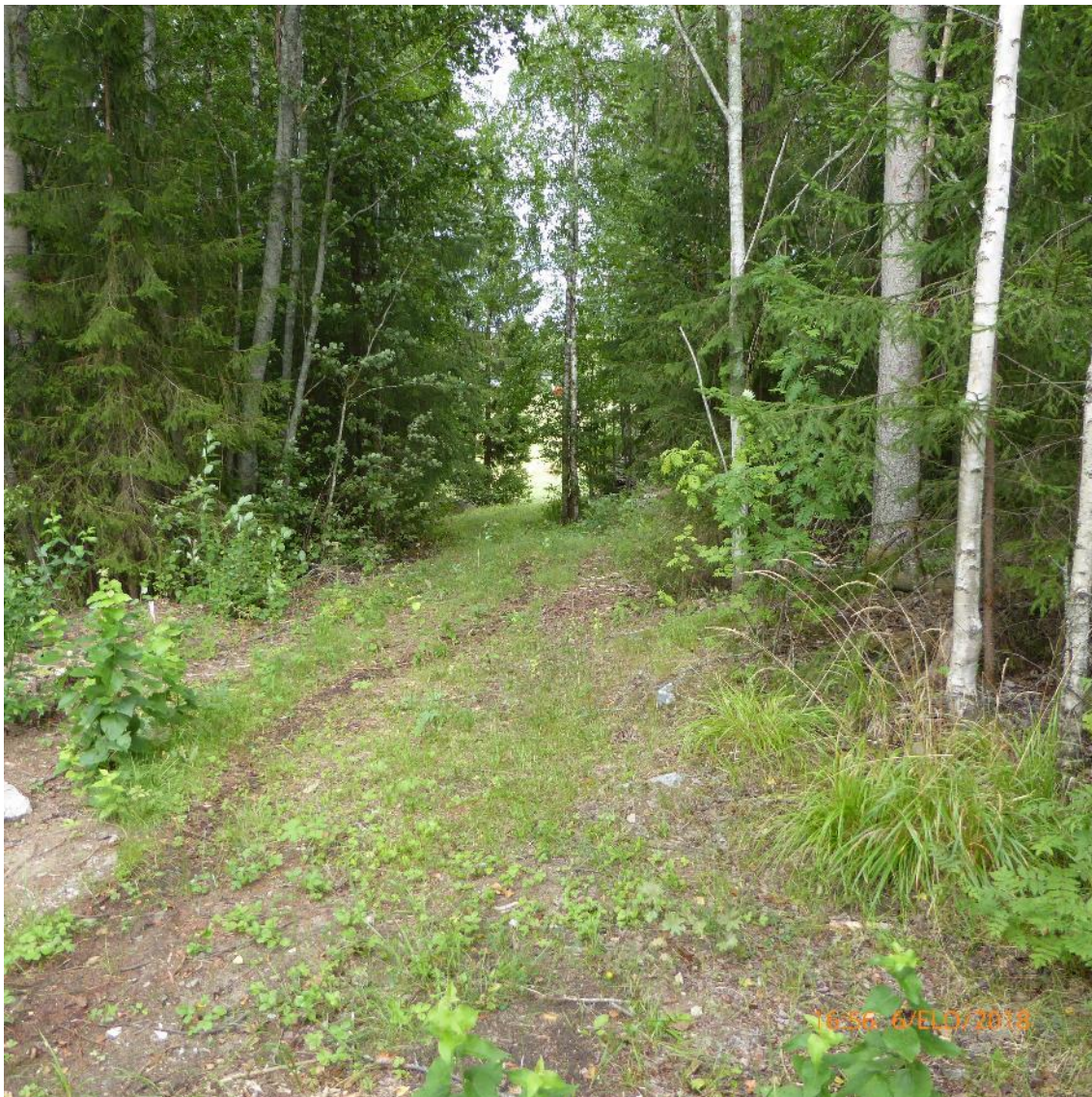
Kuva 2. Sopimustie, joka johtaa pellolle.

Toimitustiet ovat nimensä mukaisesti virallisesti tietoituksessa perustettuja teitä. Oleellista on, että kiinteistöllä on pysyvä, viranomaisten vahvistama ja rekisteröimä käyttöoikeus toisen kiinteistön kautta kulkevaan tiehen. Tällainen tieoikeus säilyy myös kiinteistökaupassa eikä uuden omistajan tarvitse erikseen sitä hakea. [2, s. 9.]