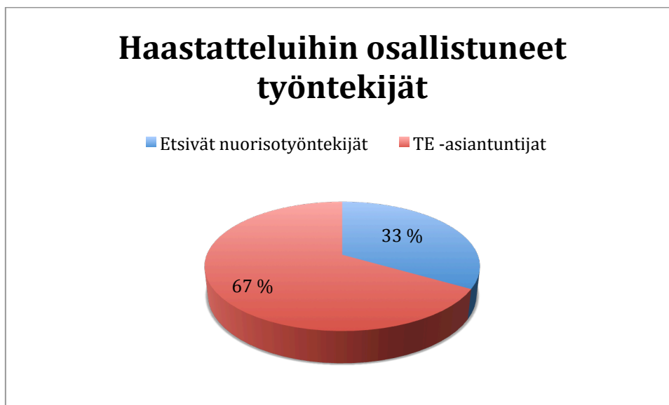
Kuva 2: Haastatteluihin osallistuneet työntekijät (n=9).

Ennen tarkempaa tulosten tarkastelua voidaan todeta, että haastatteluissa nousi vahvasti esille lähellä ja saman katon alla olevan moniammatillisen verkoston tuomat hyödyt Ohjaamotalon toiminnassa. Lisäksi paikkana Ohjaamotalo mahdollistaa kuvauksensakin mukaisesti matalankynnyksen palvelut nuorille. Asiakkaan kohtaaminen ja yksilöllisen polun rakentaminen ovat tiiviisti mukana Ohjaamotalossa tehtävässä asiantuntijatyössä.