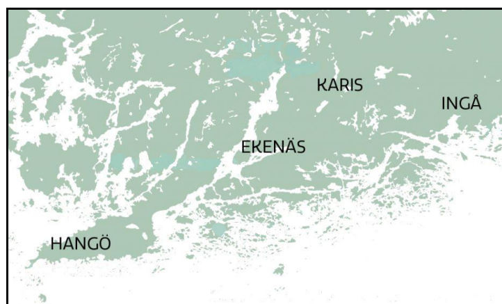
Figur 1: Karta över det geografiska område som hör till Raseborgs polisstations verksamhetsområde.

Samtliga kommuner inom Raseborgspolisens verksamhetsområde är glest bebyggda och består till stor del av landsbygd. Som det framkommer i Figur 1, har alla tre kommuner relativt stora skärgårdsområden, vilka orsakar ytterligare utmaningar för polisen att kunna vara nära befolkningen (Raseborg, 2019).