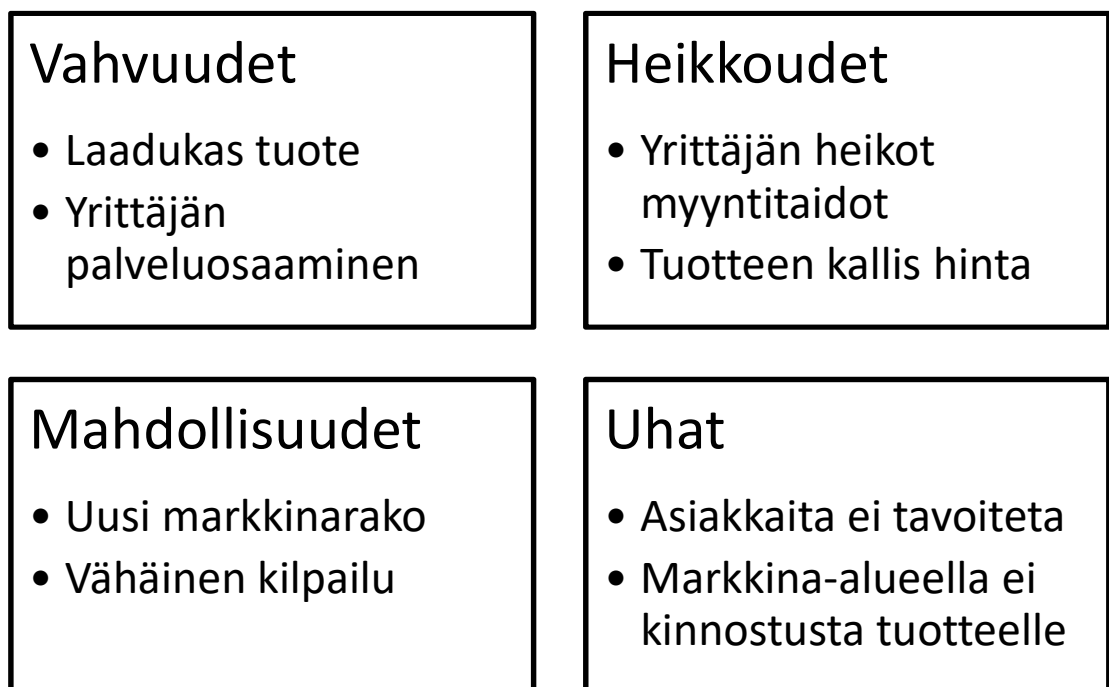
Kuva 1. SWOT-analyysi esimerkki

Liikeidean suunnittelussa ja kehittämisessä voi hyödyntää SWOT-analyysia, jossa analysoidaan yrityksen vahvuuksia, heikkouksia, mahdollisuuksia ja uhkia. Näistä vahvuudet ja heikkoudet ovat yrityksen sisäisiä ominaisuuksia ja mahdollisuudet ja uhat yrityksen ympäristön ominaisuuksia. Alla oleva kuva on esimerkki siitä, miltä yksinyrittäjän SWOT voisi mahdollisesti näyttää. (Viitala & Jylhä 2001, 59.)