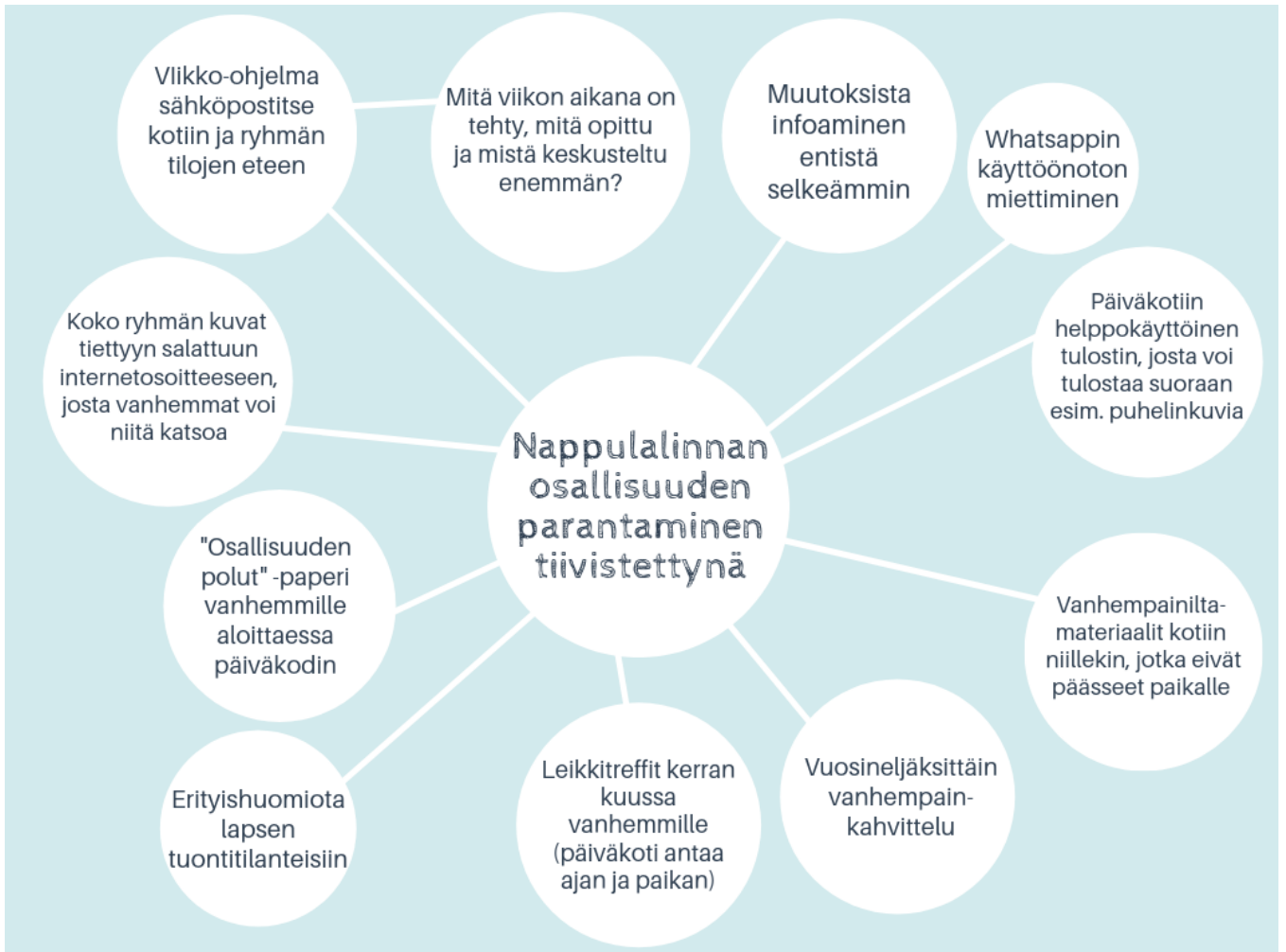
KUVIO 3: Ehdotukseni Nappulalinnan osallisuuden parantamiseksi.

edellyttävät, että tietosuoja-asiat on otettu huomioon ja vanhemmilta on pyydetty lupa valokuviin.