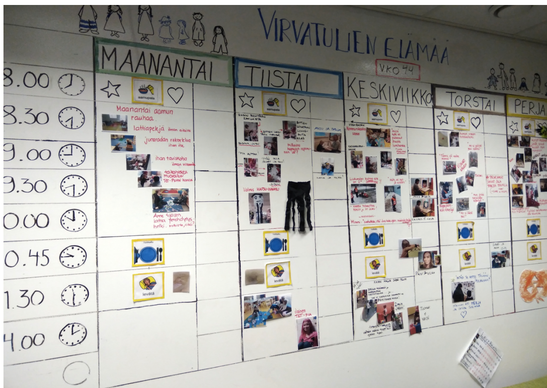
KUVA 1: Ojoisten päiväkodin elämässä.

Ojoisten päiväkodin elämässä sai minut havahtumaan kunnolla siihen, että kuvaamalla arjen pienetkin hetket leikkiessä, vanhemmille välittyvät juuri ne (mahdollisesti kertomatta jääneet) hetket muiden lasten kanssa, joista he Nappulalinnassa haluaisivat kuulla enemmän. Näitä ovat lasten sosiaaliset suhteet päivittäin, josta vanhemmat olivat todenneet halunneensa saada lisätietoa. Kuvista vanhemmat voivatkin huomata esimerkiksi, että: ”Näköjään lapseni onkin leikkinyt Aapon kanssa junaleikkiä aamulla ja iltapäivällä lukenut tiiviisti yhdessä Severin kanssa. En tiennytkään, että hän viihtyy näin hyvin myös näiden poikien seurassa, hyvä tietää! Voinkin olla yhteydessä poikien vanhempain, niin voidaan sopia vapaa-ajallekin kyläilyjä pojille.” Erityisesti tämän dokumentoinnin ja dokumentointiseinän merkitys on suuri pienten ryhmässä, kun lapset eivät vielä välttämättä osaa kertoa sosiaalisista suhteistaan muihin lapsiin. Nappulalinnan päiväkotona painottaa pedagogista dokumentointia heidän dokumentointiseinäänsä. Dokumentointiseinän tarkoitus on antaa kaikille perheille ja lapsille tietoa viikosta sekä kuvin että sanoin. Erään ryhmän varhaiskasvattajan mukaan vanhempia pitäisi kuitenkin rohkaista katsomaan dokumentointiseinää: