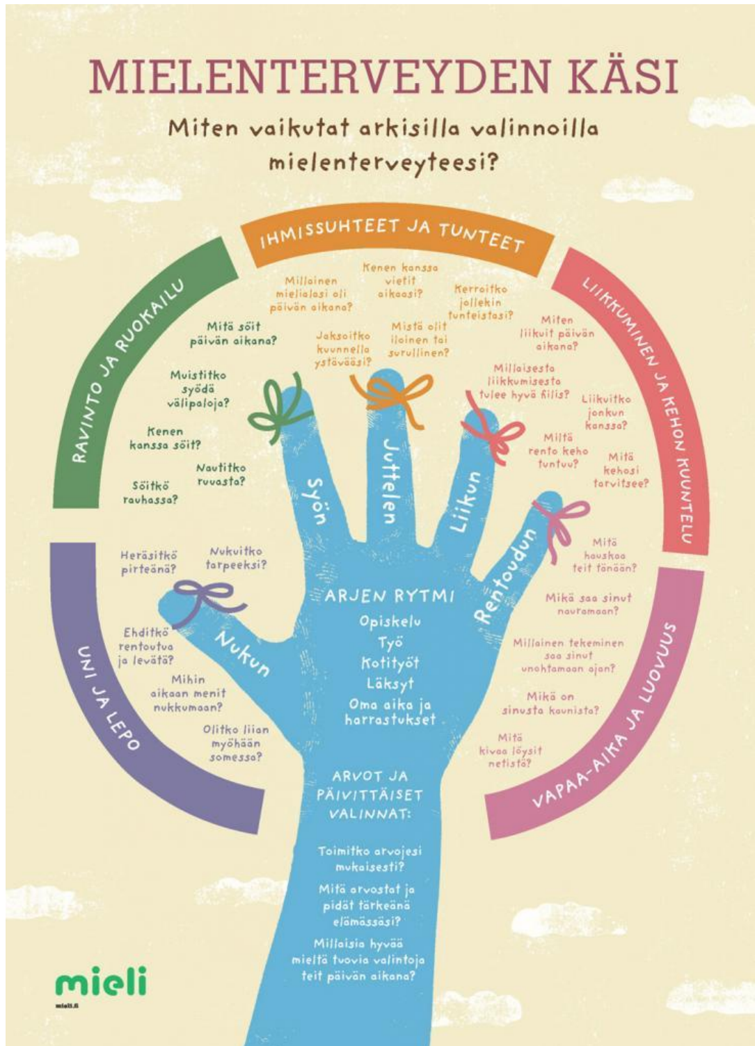
Liite 1: Mielenterveyden käsi