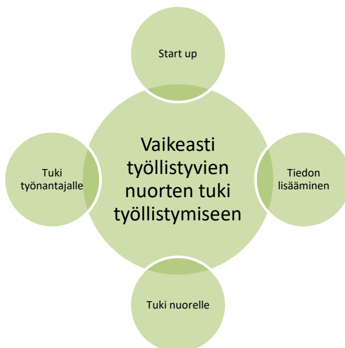
Kuva 2. Uuden nuorten työllistymistä tukevan palvelun keskeiset elementit.

Opinnäytetyöni tarkastellessa tutkittavaa aihetta myös kehittämisnäkökulmasta olen luonnostellut uudenlaisen palvelun vaikeassa työmarkkina-asetmassa olevien nuorten työllistymisen tukemiseksi. Palvelun suunnittelussa on otettu huomioon aikaisemmat tutkimukset, ennusteet työn muutoksista ja tämän tutkimuksen tulokset. Palvelun business model canvas löytyy opinnäytetyön liitteistä (LIITE 2). Seuraavasta kuvasta voi nähdä palvelun neljä keskeistä osa-alueetta.