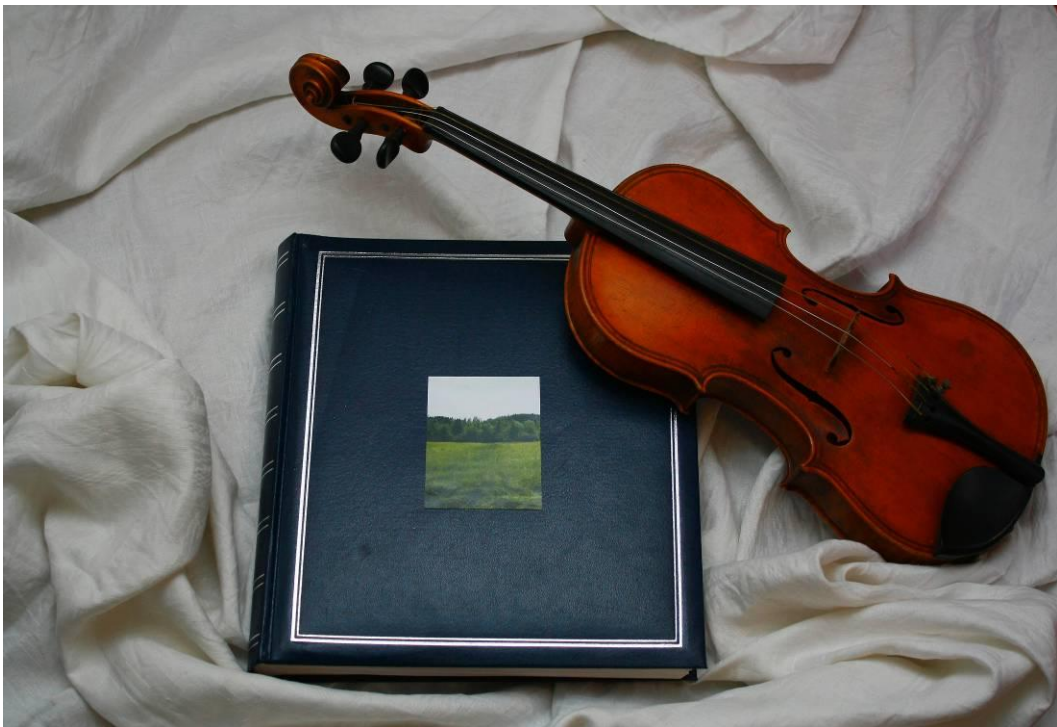
Kuva 25: Valmis valokuva albumi 16.9.2010.