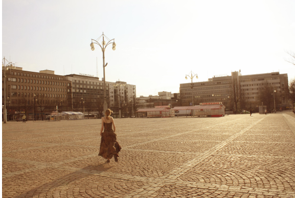
Kuva 15: Ihmisten silmien edessä.

Laura valitsi valokuva-albumiinsa muun muassa seuraavat kuvat: