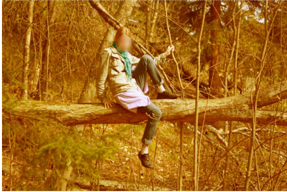
Kuva 18: Korkealla puussa.