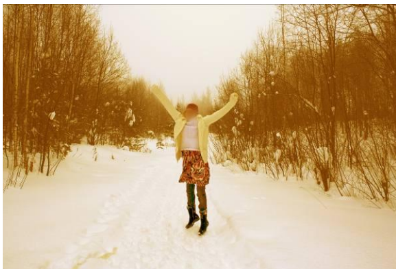
Kuva 17: Hyppää ilmaan.