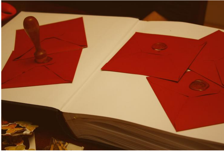
Kuva 23: Sinettien tekoa dvd-levyjen kirjekuoriin.