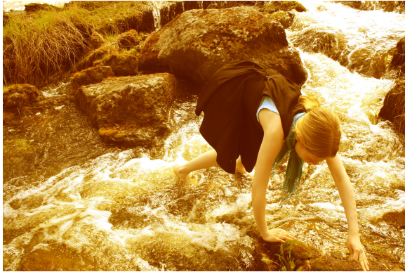
Kuva 16: Keskellä koskea.