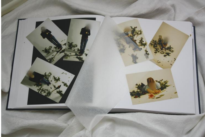
Kuva 22: Albumin sivut on tehty värisävyjen mukaan. Sävyt sointuvat toisiinsa ja musta paperi korostaa kuvien mustaa pusakkaa.