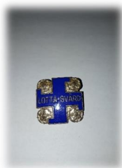
Kuvio 5: Lotta Svärd-järjestön tunnus; hakaristi ruusuilla. (Marja-Leena Pihlajamaa 2019).