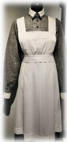
Kuvio 3: Lottapuku (Lottamuseo 2019).

esittää nousevaa auringonkehrää, joka merkitsee onnea, sillä ruusut symboloivat onnea ja rakkautta. (Lukkarinen 1981, 52-53; Rautio 2001, 36-37; Lottamuseo 2019.)