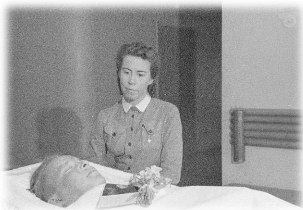
Kuvio 8: Lotilla oli tärkeä tehtävä kaatuneiden huollossa.