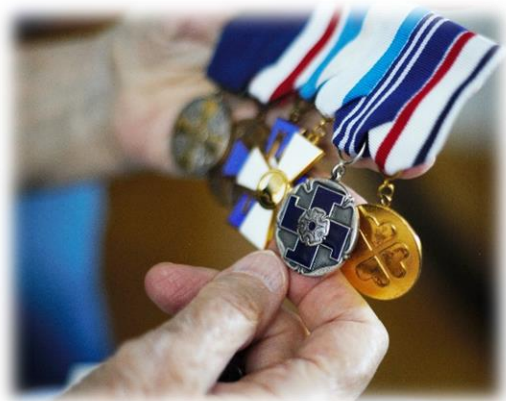
Kuvio 14: Annan lottamerkki. (Anniina Siltala 2019).