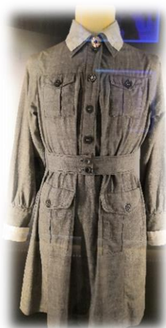
Kuvio 4: Pikkulotan puku, joka on kuulunut Elisabeth Rehnille (Lottamuseo 2019).