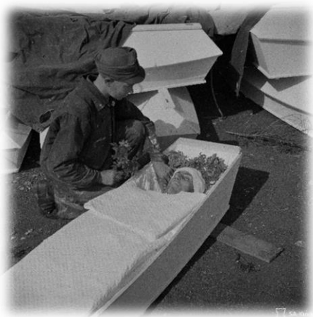
Kuvio 7: Kaatunut asetetaan arkkuun kauniisti Uuksujärven KEK:ssä heinäkuussa 1944.