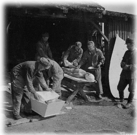
Kuvio 6: Ruumista pestään Uuksujärven KEK:ssä heinäkuussa 1944.

Jatkokuljetus tapahtui yleensä rautatievainujen avulla. Vaunun täytyttyä kaikki vainajat luetteloitiin kahtena kappaleena; toinen luettelo meni rautatievaunun kyytiin, toinen jäi KEK:iin talteen. Vainajat kuljetettiin kotipaikkakuntansa suojeluskunnille odottamaan sankarihautauksista. Kaiken tämän rankan työn lisäksi KEK:ssä riitti toimistotyötä, joka oli omalla tavallaan myös hyvin kuormittavaa. Kirjurilotat lajittelivat riiheltä tullutta tavaraa ja kirjauksiakin piti tehdä paljon. Kaikki kirjalliset tiedot otettiin vastaan vainajasta ja ne merkittiin pääkirjaan. Pääkirjasta löytyi luettelot tunnistetuista, tuntemattomista, kentälle jääneistä ja kadonneista sotilaista, jokaisesta kategoriasta omansa kortisto. Kaikki keskuksissa huolletut sotilaat merkittiin kirjaan mainiten samalla ruumiin kohtalo sekä tiedot jäämistöistä. (Lehtonen 1973, 17-18; Palva 2000, 26-28, 35.)