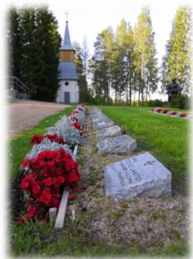
Kuvio 10: Pellon sankarihautausmaan hautoja. (Anniina Siltala 2019).