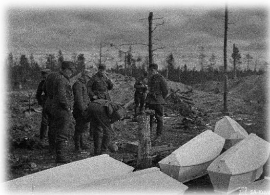
Kuvio 11: Talvisodassa hautautuneiden miesten jäännöksiä kootaan arkkuihin Summassa 1941.

kenttähautoihin, sillä välillä kaatuneiden huollossa oli vaikeat olosuhteet. Joukot etenivät nopeasti intensiivisen taistelutilanteen vuoksi, kesä oli lämmin ja kuljetuspuolella oli ajoittain ongelmia muun muassa välineistön puuttumisen vuoksi. Lisähaastetta toi sekin, että huoltohenkilöstö ei ollut koulutettua, eikä kouluttamiseen ollut tarpeeksi aikaa. Heinäkuussa 1941 tehtiinkin tilapäishautauksia, mikäli kotiinkuljetus ei juuri sillä hetkellä ollut mahdollista. Tällaisissa tapauksissa kaatuneen omaisilla oli kuitenkin mahdollisuus saada läheisensä myöhemmin kotiseudulle; ratkaisu oli siis vain väliaikainen. Kenttähautoyksissä kaatunut huollettiin samalla lailla kuin muutenkin ja haudalla pidettiin lyhyt hartaushetki. Kesän 1941 aikana evakuoimiskeskukset perustivat yhteensä 49 tilapäishautausmaata, joihin haudattiin noin 8500 kaatunutta sotilasta. Nämä haudat purettiin kesän jälkeen ja keväällä 1942 ruumiit lähetettiin kotiseudulle. (Lehtonen 1973, 27; Saario 1989, 166-167, 183-185.)