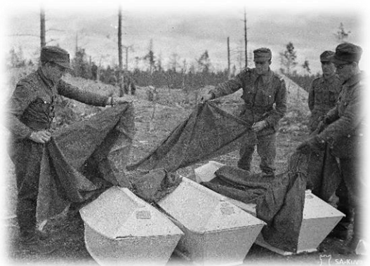
Kuvio 12: Arkut peitetään ja lähetetään kotiseudulle 1941.