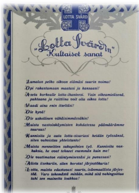
Kuvio 1: Lotta Svärd-järjestön kultaiset sanat (Lottamuseo 2019).

1930-luvun aikana lottien koulutustoiminta kehittyi paljon. Koulutus keskittyi erityisesti jaostokoulutukseen. Jaostot jakautuivat muonitukseen, lääkintään, viestintään, ilmavalvontaan, kansliatyöhön, kaasusuojeluun, hevosten hoitoon ja tyttötyöhön. Koulutus oli erilaista riippuen siitä, mihin jaostoon lotta kuului. Jokaisella jaostolla oli luonnollisesti oma tärkeä roolinsa, mutta lääkintäjaoston asema nousi erityiseksi. Suomen Punaisen Ristin kanssa yhteistyötä tekevässä lääkintäjaostossa järjestettiin lääkintäkurseja sekä sairaanhoitoapulaiskursseja. Näin lotat oppivat muun muassa tärkeitä ensiaputaitoja. (Suojeluskuntien ja Lotta Svärdin Perinteiden Liitto ry 2017e.)