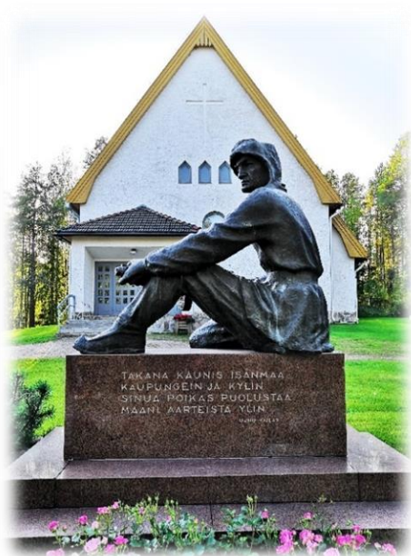
Kuvio 9: Sotilaspatsas Pellon sankarihautausmaalla Uuno Kailaksen runolla. (Anniina Siltala 2019).

Pohtola 2004, 13, Sotavainajien muiston vaalimisyhdistys). Sankarihautausmaita sijaitsee ympäri Suomea; alla esimerkkikuvia Pellon sankarihautausmaalta.