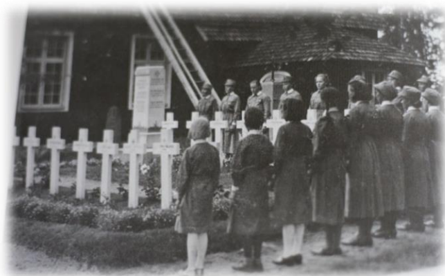
Kuvio 13: Lottia ja pikkulottia vartiassa Temmeksen sankarihaudoilla.

Annan vaativa ja raskas työ pikkulottana on vaikuttanut hänen myöhempään elämäänsä. Hän kuitenkin kokee, että on päässyt puhumaan asioista perheensä ja muiden samaa kokeneiden kanssa. Lisäksi hän liittyi veteraaniliittoon vuonna 1994, heti eläkkeelle jäätyään. ”Siitä on puhuttu. Sitä on saanu purkaa. Ja sitä on kukin omia kokemuksiansa kertonu. Siitä on saatu tämmönen iso kimppu asioita. Mahtavia asioita, joita ei, siis en minäkään lapsena ymmärtäny yhtään kaikkia mitä tehtiin. Sitä tehtiin vaan.” Hän osaa olla myös kiitollinen, vaikka kokemus on ollut henkisesti vaikea. ”Olen kyllä kiitollinen kaikesta. Mä olen syntynyt sunnuntaina. Ja mä oon kyllä kokenut että mä oon sunnuntain lapsi. Että eihän elämä olis sitä että kaikki olis ruususta. Ne täytyy olla ne piikitkin. Ja niitä on ollu. Mutta joka tapauksessa olen kiitollinen. Joka hetkestä minkä mä elin.”