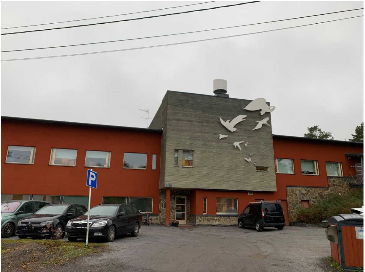
Kuva 1 Lakkatien erityislastenkoti

Lakkatien lastenkodin henkilökuntakokoonpanoon sisältyy talon johtaja, 3 osastovastaavaa, 21 ohjaajaa, 3 sairaanhoitajaa, talon psykologi sekä kokki ja talousapulaiset. Ohjaajien tehtävänä on toimia lasten ja nuorten kanssa päivittäin, hoitavat lasten talon ulkopuolisia asioita iästä riippuen, sekä tekevät kasvatuksellisia päätöksiä lasten edun mukaisesti. Lastensuojelun laitoshuollossa omahoitajamenetelmää pidetään yksilöllisenä hoito- ja kasvatustapahtumana. Omahoitajamenetelmä tarkoittaa sitä, että nimitetään tietty työntekijä tai työntekijäpari yhdelle lapselle tai nuorelle toteuttamaan sitoutumista vaativaan suunnitelmalliseen ja pitkäjänteiseen kasvattamiseen ja hoitamiseen lastensuojelulaitoksissa. (Karppinen 1999, 14). Lakkatien lastenkodissa lapsilla on omahoitajaparit, jotka pääsääntöisesti toimivat vanhempien kanssa yhteistyössä sekä opettajien, lääkäreiden, sosiaalityöntekijöiden ja muun ulkopuolisen monialaisen verkoston kanssa. Omahoitajatyön tarkoitus on ensisijaisesti vastata lapsen yksilöllisiin tarpeisiin, kuten myös perusteellisempi hoito- ja kasvatustyön hahmottaminen. (Karppinen 1999, 14).