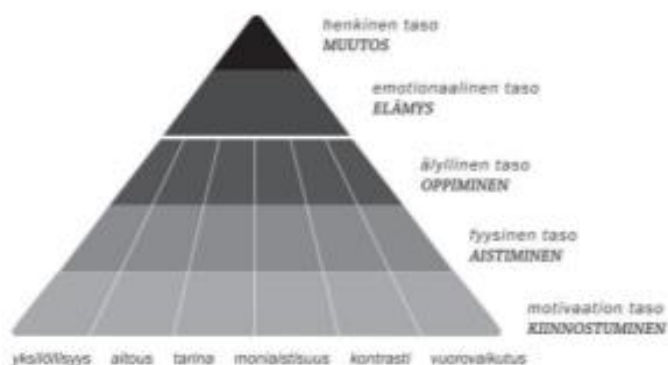
Elämyskolmio. (Tarssanen & Kylänen 2009)

Lapset ja nuoret löysivät liikunnasta vuonna 2018 vähemmän merkityksellisiä asioita kuin aikaisemmin. Ovatko digitaalisesta ympäristöstä saatavat virikkeet syrjäyttämässä liikunnasta saatavan elämyksellisyyden? (Korjus & Korsberg 2019) Elämys on positiivinen ja muistettava kokemus, joka voi tuottaa henkilökohtaisen muutoksen kokijalleen. Elämyksellisyys kokonaisuudessaan muodostuu eri tasoista ja elementeistä, sitä voi hahmottaa alla olevan elämyskolmion avulla. (Tarssanen & Kylänen 2009)