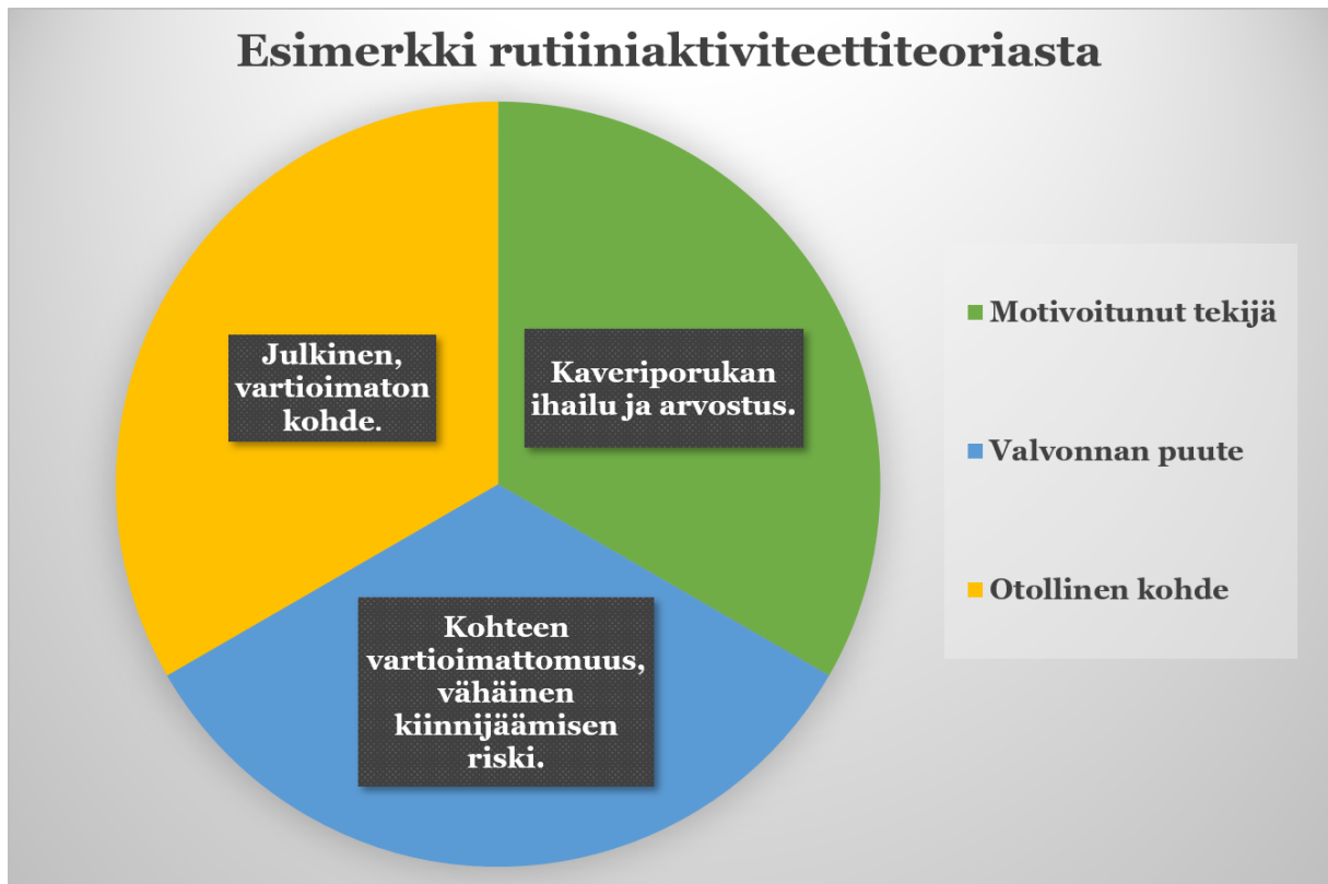
Kuvio 1: Esimerkki rutiiniaktiiviteetti-teoriasta sovellettuna nuoren vahingontekijän näkökulmaan (Koskela & Nurminen 2010, 9).

Rikosten, kuten vahingontekojen ennaltaehkäisy on aina taloudellisempaa, kuin niiden korjaaminen ja selvittäminen. Rikoksia voidaan ennaltaehkäistä muun muassa lisäämällä kiinnijäämisen riskiä sekä vaikeuttamalla tai jopa poistamalla teon mahdollisuus. (Suomen Riskienhallintayhdistys ry 2019.)