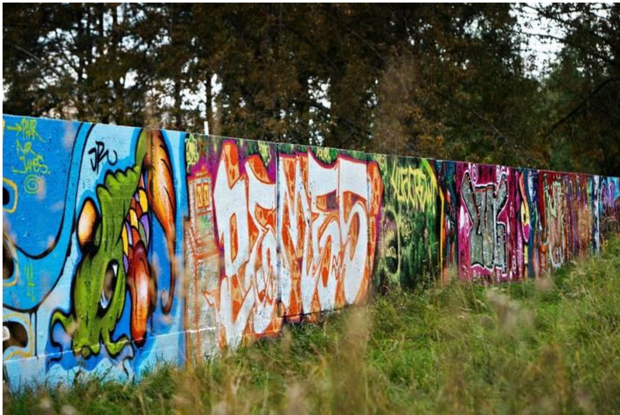
Kuva 5: Toinen Kuopion laillisista maalauspaikoista Niiralan uimahallin ja junaradan läheisyydessä.

2012). Lailliset graffitiseinät ovat olleet toimivia välineitä vahingontekoina tehtyjen spraymaalauksien vähentämiseen ja niitä löytyykin jo useimmista suurista kaupungeista. Pääkaupunkiseudulla niitä on selkeästi eniten.