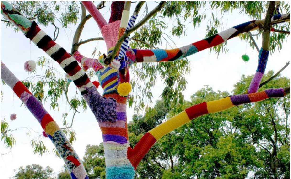
Kuva 4: Neulegraffiti on yksi viime vuosina yleistynyt katutaiteen muoto (Yeesi.fi 2019).

Yhteistyökumppaneiksi toiminnalliseen osioon voisi pyytää jotakin katutaiteeseen keskittyntä yhdistystä, kuten Kuopiossa toimivaa Katutaideyhdistys Urbaani ry:tä tai muita katutaiteilijoita. Urbaani on perustettu vuonna 2015 tukemaan ja edistämään sekä myös ylläpitämään ja tallentamaan Kuopion katutaidetta. Yhdistys on perustettu vuonna 2010 perustetun urbaani.org -verkkosivun pohjalle, joka toimii muun muassa Kuopion katutaiteen ilmiöiden tiedotuskanavana. Urbaani ry järjestää myös työpajoja erilaisille ryhmille. (Katutaideyhdistys Urbaani ry 2019a.)