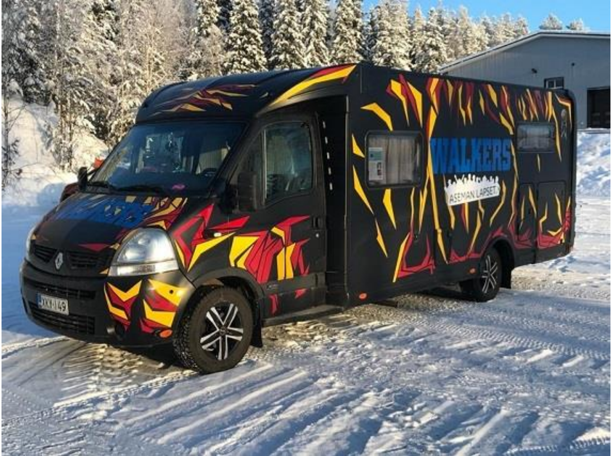
Kuva 1: Walkers-auto Tiikeri (Point.fi 2019b).

koista – Kissa, Ilves, Leijona ja Tiikeri. Walkers On Wheels -hanke on rahoitettu veikkosuosittovarain opetus- ja kulttuuriministeriön avustuksella ja sitä koordinoi Aseman Lapset ry. (Aseman Lapset ry 2019a.)