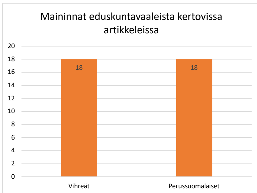
Kuvio 1. Maininnat eduskuntavaaleista kertovissa artikkeleissa.

Aloitin tutkimukseni laskemalla, kuinka monta kertaa mikin puolue oli mainittu seurantajak- son uutisissa. Laskin puolueen mainituksi, vaikka puolueen nimi olisikin noussut esiin ai- noastaan muussa osiossa kuin leipätekstissä. Tämä tarkoittaa esimerkiksi otsikkoa, ing- ressiä, kuvatekstiä, kaaviota tai faktalaatikkoa.