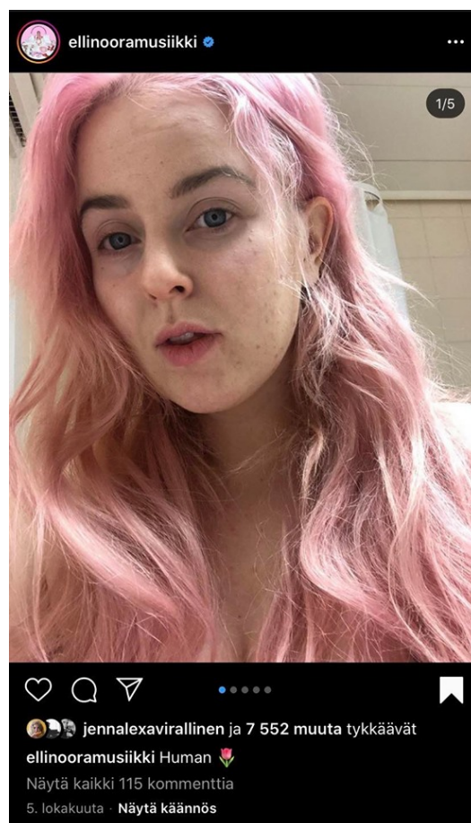
Kuva 2: Ellinooran Instagram-kuva