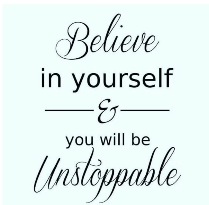
Kuva 5: Tyypillinen inspiraatiolause itseensä uskomisesta

Havaintojeni mukaan itsevarmuutta voi harjoitella ja sitä karttuu automaattisesti tekemisen ja kokemuksen myötä. Minulle henkilökohtaisesti takaiskut ovat toimineet motivaattorina ”näyttää kaikille”, ja onnistumisen hetket ovat tuntuneet erityisen hyviltä ja kannustavilta. Toki ihmiset ovat erilaisia ja heillä on erilaisia kokemuksia, jotka vaikuttavat heihin eri tavoin. Mielestäni on kuitenkin hyvä tiedostaa se, että huonoja hetkiä varmasti osuu jokaisen uralle, mutta niiden yli myös pääsee tekemällä työtä.