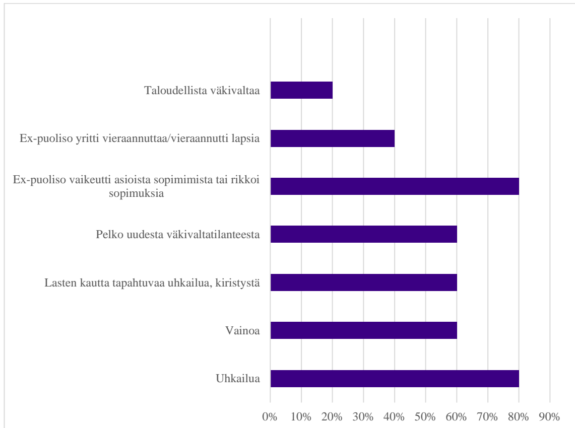
KUVIO 2. Vastaajien kokemat väkivallan muodot.

Suurimmalla osalla vastaajista parisuhde oli päättynyt ja väkivalta jatkunut erosta huolimatta. Vastaukset tukevat teoriasta noussutta tietoa siitä, että väkivalta jatkuu usein erosta huolimatta. Alla olevassa kuviossa on eriteltyinä väkivallan muodot, joita vastaajilla esiintyi eron jälkeen.