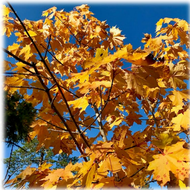
Kuva 1 Katri Jussila