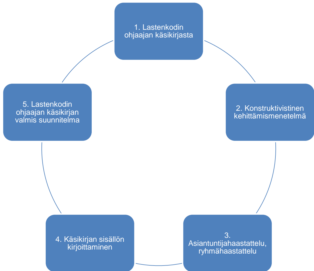
Kuvio 1 Prosessikuvaus työstä