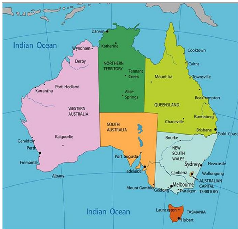
Kuva 1. Australian kartta (Emigrate to Australia 2017)

Australia on uniikki ja monipuolinen maa suuren kokonsa vuoksi. Se sijaitsee eteläisellä pallonpuoliskolla ja on maailman suurin saari sekä ainoa valtio, joka on samalla myös kokonainen manner. Australiassa on yhteensä kuusi osavaltiota ja useita territorioita, joista vain kaksi sijaitsee mantereella. Osavaltioita ovat Länsi-Australia, Etelä-Australia, Queensland, Uusi Etelä-Whales, Victoria ja Tasmania. Manner Australiassa sijaitsevat territoriot ovat Australian pääkaupunkiterritorio ja Pohjoisterritorio. (Australia 2017.) Ohessa kuva Australian kartasta, jossa on osoitettuna kaikki Australian osavaltiot.