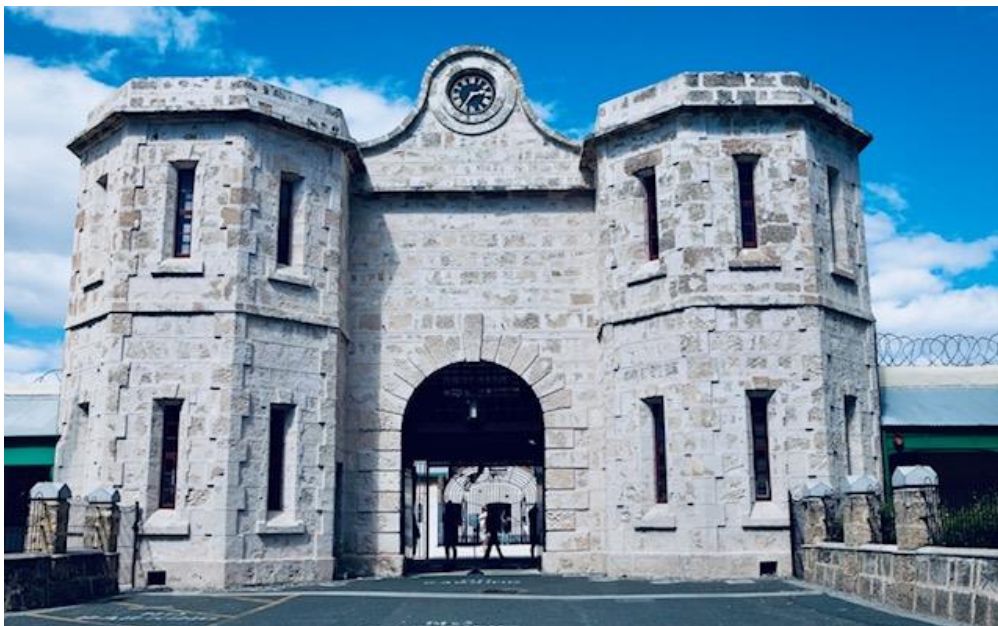
Kuva 5. Fremantlen historiallinen vankila

Fremantlen historiallinen vankila on yksi Länsi-Australian tärkeimmistä kulttuurikohteista ja matkailun vetovoimatekijöistä. Se on myös Länsi-Australian ainut maailmanperintökohde, joka rakennettiin 1850-luvulla maximaalista vankeutta tarvitseville rikollisille. (Tourism Western Australia 2018.) Fremantlen vankila suljettiin vasta 1991, ja jo vuonna 1992 alkoivat ensimmäiset opaskierrokset. (Fremantle Prison 2019.) Kuvassa 5 näkyy Fremantlen historiallisen vankilan massiivinen pääportti.