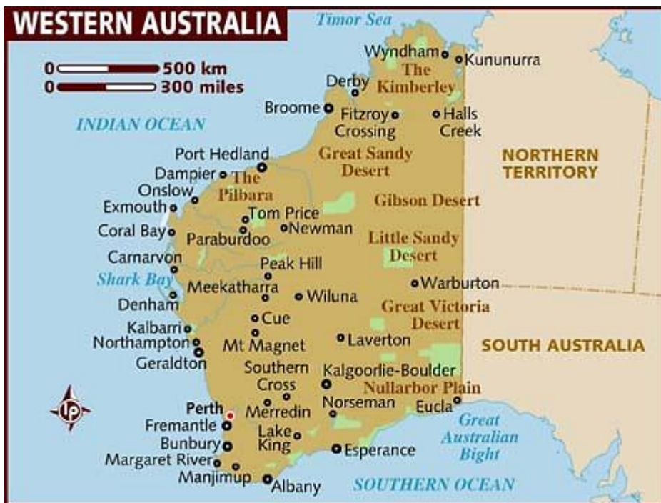
Kuva 2. Länsi-Australian kartta (Lonely Planet 2017)

Länsi-Australia on pinta-alaltaan noin 7,5 kertaa Suomen kokoinen ja kattaa kolmanneksen koko Australian pinta-alasta. Kokoonsa nähden asukkaita on kuitenkin vain noin 2,6 miljoonaa. (Chapman 2008, 147; Turner 2017, 556.) Kuten aikaisemmin on mainittu, Länsi-Australia on tunnettu sen tuhansista hiekkarannoistaan ja pitkästä rannikostaan, jotka houkuttelevat turisteja puoleensa yhä enemmän. Seuraavana kuva Länsi-Australian kartasta, jossa on merkittynä Perthin kaupunki punaisella pisteellä.