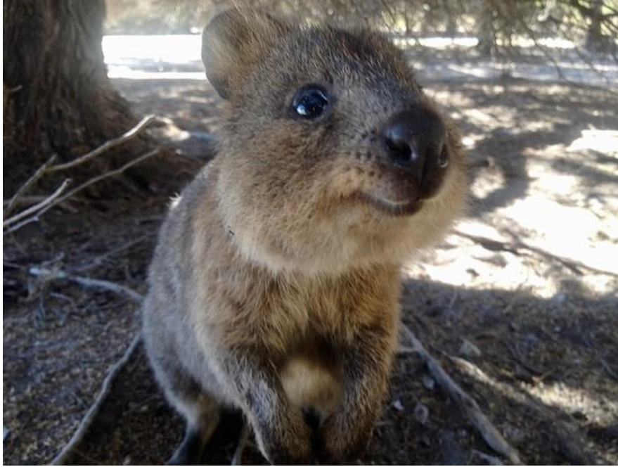
Kuva 7. Rottnestin saarella asuva quokka

Rottnest on 90 minuutin venematkan päässä Perthin tai Fremantlen satamista. Se on pieni saari, jossa ihmiset liikkuvat ainoastaan joko pyörillä, kävellen tai sähkömopoilla sillä sen luonto ja eläimet kuten valaat, hylkeet ja harvinaiset quokka-eläimet halutaan pitää rauhassa. Rottnestille pääsee myös omalla veneellä tai nopeammin pienellä potkurikoneella. Rottnest omaa uskomattomat 63 rantaa, 20 poukamaa ja monia koralliriuttoja, jotka ovat yksiä Australian hienoimpia uima- ja sukeltelupaikkoja. (Tourism Australia 2019.) Kuvassa 8 näkyy Rottnestin yksi monista kirkkaan sinisistä kalliopoukamista.