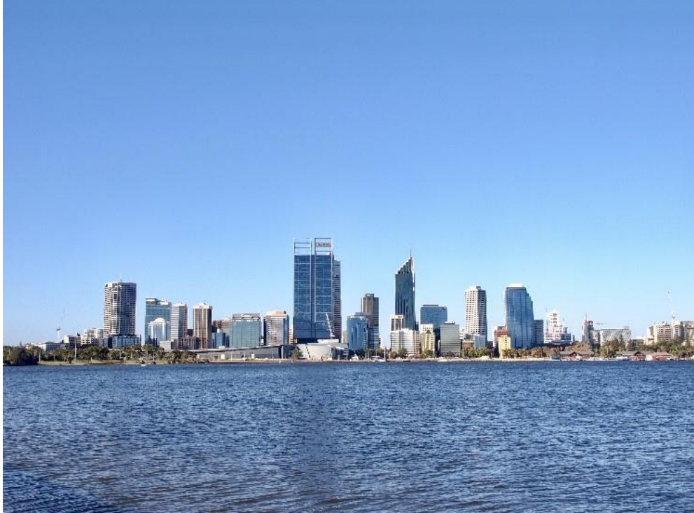
Kuva 3. Perth, Elizabeth Quay

Lonely Planetin (Lonely Planet 2019.) mukaan parhaat matkustuskuukaudet Perhtiin ovat helmikuu, maaliskuu sekä syysky. Helmikuussa Perthissä alkaa taidefestivaali sekä koulut alkavat, jonka vuoksi rannat ovat tyhjempiä ihmisväestä. Maaliskuussa ilmasto on sopivan lämmin ja kuiva muodostaen täydellisen rantakelin. Syyskuussa taas Kings Parkin kasvitieteellisen puutarhan kasvit kukkivat sekä kaupunkiin saapuu suosittu Listen Out musiikkifestivaali ja vuoden suurin huvipuistotapahtuma nimeltään Perth Royal Show. (Lonely Planet 2019.)