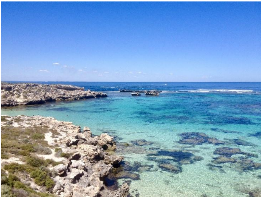
Kuva 8. Rottnestin saari (Laaksonen, H. 2016)

Rottnest on 90 minuutin venematkan päässä Perthin tai Fremantlen satamista. Se on pieni saari, jossa ihmiset liikkuvat ainoastaan joko pyörillä, kävellen tai sähkömopoilla sillä sen luonto ja eläimet kuten valaat, hylkeet ja harvinaiset quokka-eläimet halutaan pitää rauhassa. Rottnestille pääsee myös omalla veneellä tai nopeammin pienellä potkurikoneella. Rottnest omaa uskomattomat 63 rantaa, 20 poukamaa ja monia koralliriuttoja, jotka ovat yksiä Australian hienoimpia uima- ja sukeltelupaikkoja. (Tourism Australia 2019.) Kuvassa 8 näkyy Rottnestin yksi monista kirkkaan sinisistä kalliopoukamista.