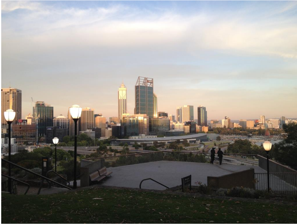
Kuva 4. Näkymä Perthin kaupunkiin Kings Parkista

Fremantlen historiallinen vankila on yksi Länsi-Australian tärkeimmistä kulttuurikohteista ja matkailun vetovoimatekijöistä. Se on myös Länsi-Australian ainut maailmanperintökohde, joka rakennettiin 1850-luvulla maximaalista vankeutta tarvitseville rikollisille. (Tourism Western Australia 2018.) Fremantlen vankila suljettiin vasta 1991, ja jo vuonna 1992 alkoivat ensimmäiset opaskierrokset. (Fremantle Prison 2019.) Kuvassa 5 näkyy Fremantlen historiallisen vankilan massiivinen pääportti.