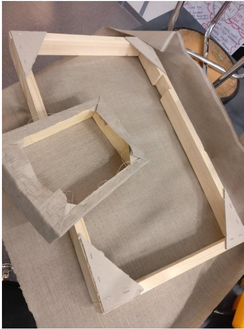
Kuvio 2. Taulupohjien tekoa Starttipajalla.

Luovuuden nuoret näkivät vapautena toimia ja toteuttaa. Yli puolet nuorista mainitsi luovuuden esiintyvän työpajalla siten, että he saavat käyttää luovuutta, vapaat kädet tehdä ja tuottaa halutun asian mieluisalla tavalla ohjaajan ohjeistuksen raamien sisällä. Lisäksi vastauksissa tuli esille, että ohjaajat kuuntelevat nuorten toiveita. Toiveiden kuuntelemista vahvisti myös havainnointikerralla nähty toivepurkki, mihin nuoret saavat toivoa erilaista toimintaa ja tekemistä. Luovuuden esiintymisestä kertoo seuraavat nuorten vastaukset.