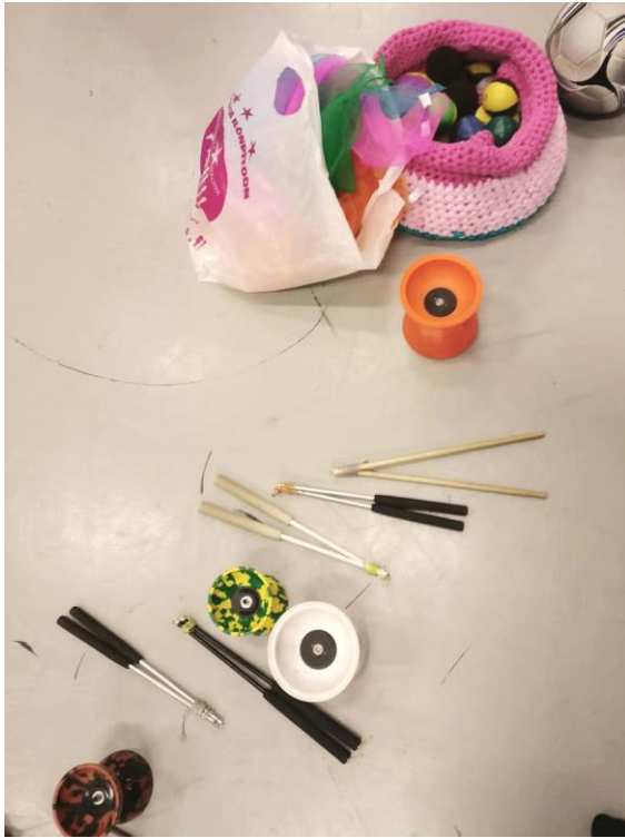
Kuvio 3. Volttipajan havainnointipäivän sirkusvälineitä.

Nuoria pyydettiin haastattelussa pohtimaan, millä muilla tavoin kuin taiteellisena toimintana taiteellisuus ja luovuus esiintyvät Nuorten taidetyöpajalla. Vastauksissa esiintyi useasti samankaltaiset vastaukset, jotka ovat kvantifioitu oheiseen taulukkoon. (Ks. Taulukko 3.)