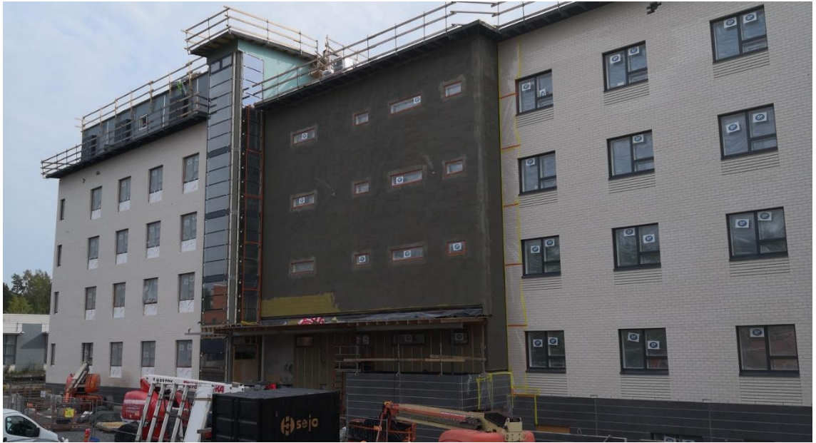
Kuva 4. Pohjarappauksen ensimmäinen kerros lähes valmis.