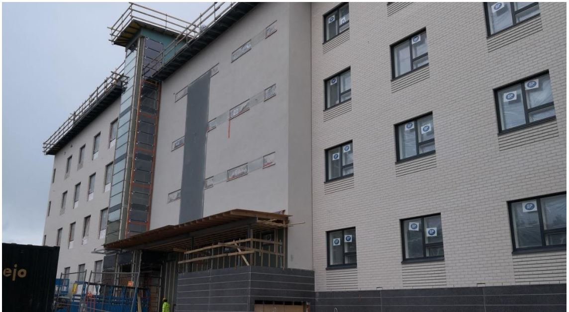
Kuva 5. Rappaus muutamaa tehostekenttää vaille valmis.