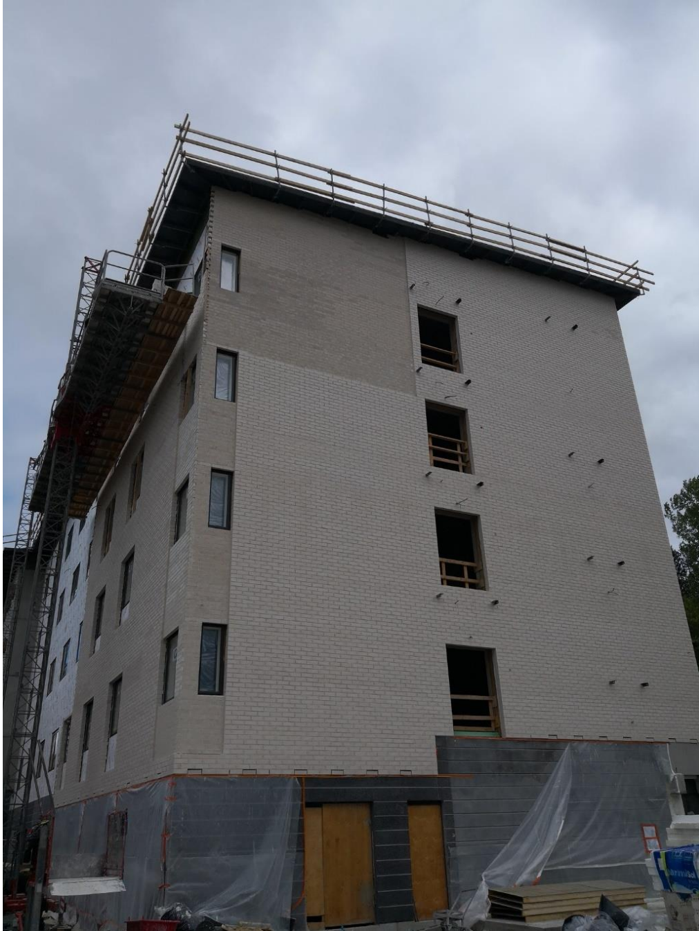
Kuva 3. Rakennuksen päätyseinä muurattu. Kulmassa moduulitiellä tehty rapattava alue.