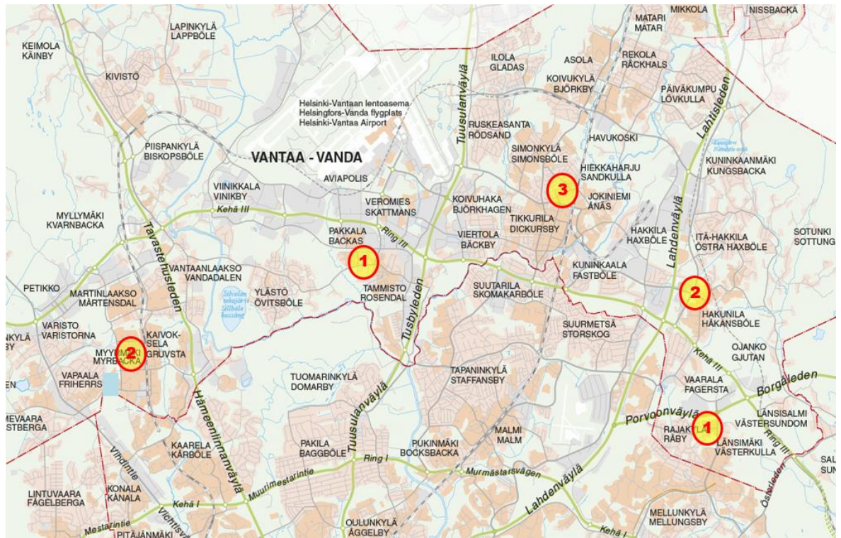
Kuva 3, karttaphoja Vantaasta

Kuva 3 on toteutettu samalla tavalla kuin kuva 2 Helsingistä. Espoon osalta ei ollut tarvetta tehdä kuvaa etsintäkuulutettujen vähäisen määrän takia.