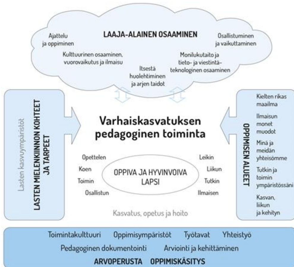
Kuvio 1. Varhaiskasvatuksen pedagogisen toiminnan viitekehys (Opetushallitus 2018, 36).