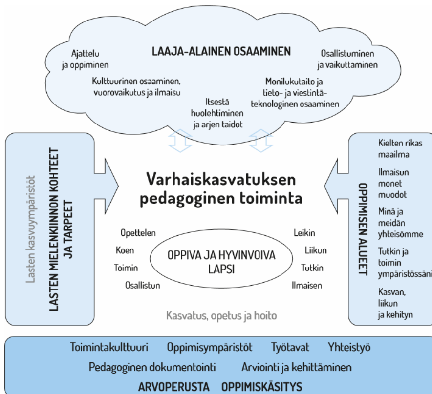
Kuva 1. Varhaiskasvatuksen pedagogisen toiminnan viitekehys (Opetushallitus 2019b, 36)

Varhaiskasvatuksen pedagogiikan tavoitteena on edistää lasten hyvinvointia, oppimista ja laaja-alaista osaamista. Toiminnan suunnittelussa täydentävät toisiaan lapsen aloitteesta, sekä henkilöstön johdolla toteutettu suunniteltu ja tavoitteellinen toiminta. Toiminta toteutuu lasten ja henkilöstön yhdessä tekemisessä ja vuorovaikutuksessa. Tätä pedagogisen toiminnan viitekehystä ja sen kokonaisvaltaisuutta, jonka keskiössä on oppiva ja hyvinvoiva lapsi on kuvattu alla olevassa kuvassa 1. (Opetushallitus 2019b, 36.)