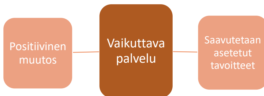
KUVIO 2. Vaikuttavan palvelun ominaisuudet

Alatalo ym. (2017, 11) toteaaakin vaikuttavan perhekuntoutuksen edellytyksiä olevan kokonaisvaltainen tukeminen ja jatkumolliset tavoitteet sekä työskentelysuhteet. Perhekuntoutuksen vaikuttavuutta vahvistavana tekijänä nähdään myös monitoimijaiset yhteistyöverkostot. Alla kuvattu tutkimustuloksista tärkeimmäksi nousseet vaikuttavan palvelun ominaisuudet.