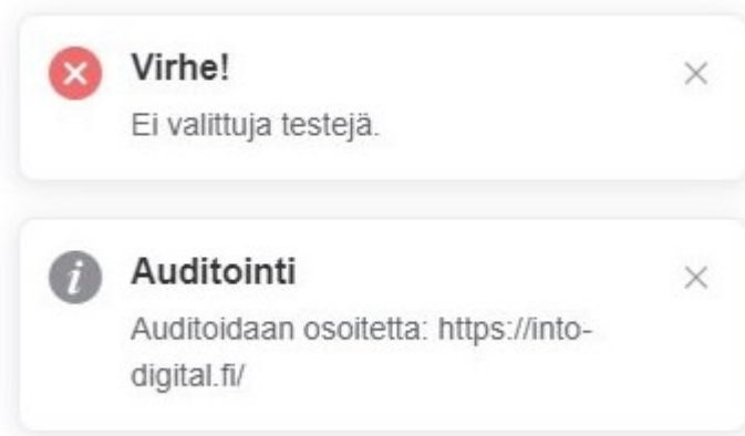
Kuvio 7. Saavutettavuustyökalun ilmoitukset

Auditoi-painikkeen vieressä on osoitteiden kopioimiseen tarkoitettu painike, jota painamalla kaikki osoitteet voidaan kopioida tietokoneen leikepöydälle. Kaikille painikkeille, joilla ei ole tekstiä, on toteutettu työkaluvinkki Element.io Vue.js-kirjastolla. Vinkki näytetään, kun käyttäjä vie hiiren painikkeen päälle.