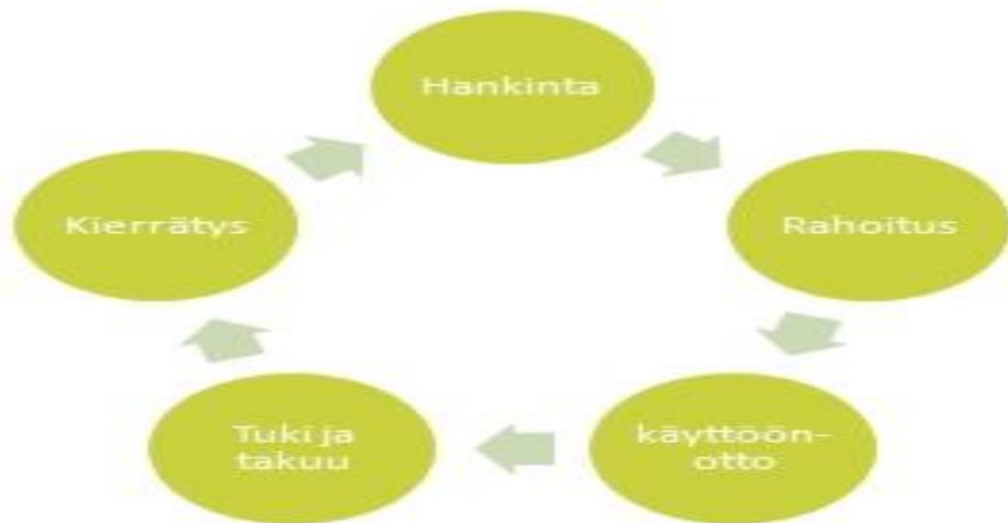
KUVIO 1 Elinkaarimalli (Pelkät laitteet eivät aina yksin riitä, hakupäivä 18.11.2010)

Vihreä IT on ympäristöystävällinen keino tuottaa ja käyttää IT –palvelu. Sen päätavoitteena on pienentää eri toimialojen nykyään nopeasti kasvavia IT –päästöjä.