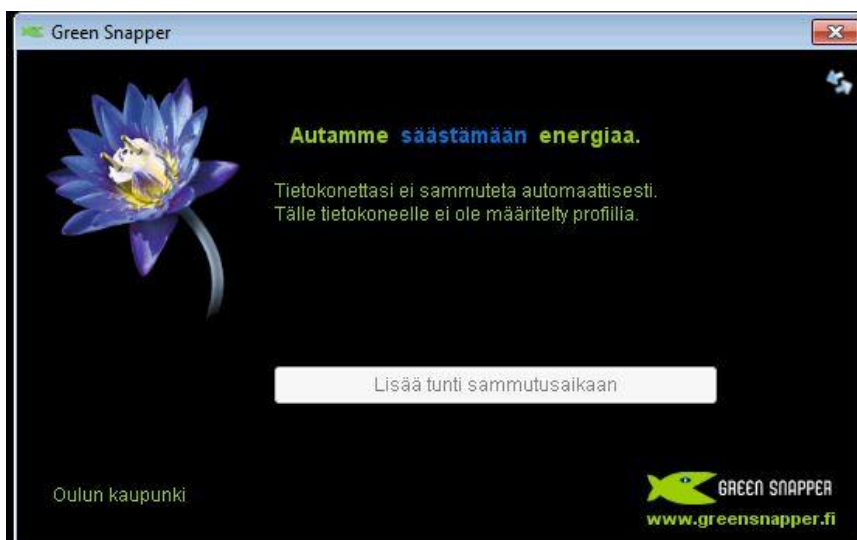
KUVIO 7 Green Snapper –virranhallintaohjelman päävalikko