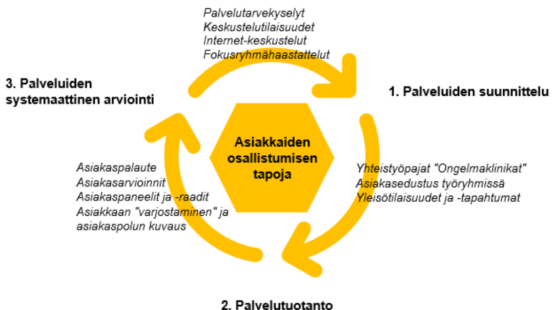
Kuva 1. Osallistumisen tavat (mukaillen Larjovuori ym. 2012, 18)

Palveluita kehitettäessä asiakkaiden näkökulma unohtuu helposti. Tällöin vaarana on jatkuva palveluiden kehittäminen ilman, että palvelut koskaan vastaavat asiakkaiden tarpeita. Asiakkaat on nostettava kehittämistoiminnan keskiöön, sillä heillä on hiljaista tietoa, jota palveluiden kehittäjillä ei välttämättä ole. (Virtanen ym. 2011, 55–58.) Asiakaslähtöisessä ajattelussa asiakas nähdään aktiivisena toimijana (Virtanen ym. 2011, 19), joka edustaa koko asiakasryhmän kokemuksia ja osallistuu yhteisten palveluiden suunnitteluun (Toikko 2012, 123). Asiakaslähtöisessä toimintamallissa palvelut suunnitellaan ja rakennetaan yhdessä asiakkaan kanssa. Asiakas on mukana koko kehittämisprosessin ajan. Tässä toimintamallissa kehittämisideat voivat tulla palvelutuottajan lisäksi myös asiakkaalta. Asiakas kokeilee yhdessä kehitettyä palvelua, minkä pohjalta saadun käyttäjäkokemuksen avulla palvelun kehittämistä voidaan jatkaa edelleen. Jotta palveluita voidaan kehittää asiakaslähtöisemmiksi, palvelun käyttäjiltä saatu palaute on huomioitava kehittämistyössä. (Virtanen ym. 2011, 37.) Lisää tapoja, joilla asiakas voidaan ottaa mukaan palveluiden kehittämisprosessiin, esitellään kuvassa 1.