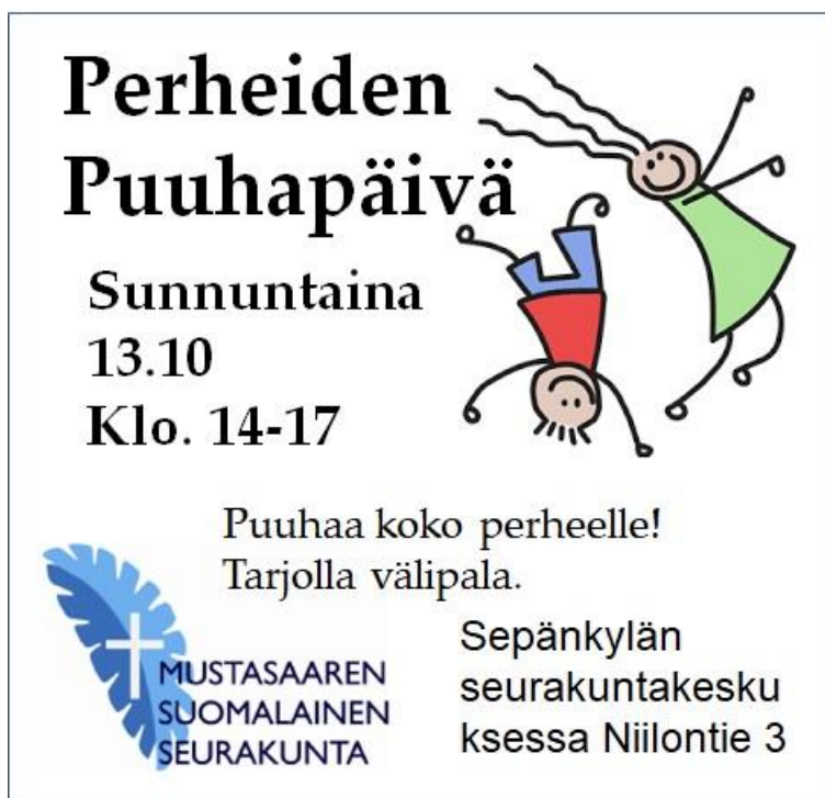
KUVA 1. Mainos Silta-lehdessä

Puuhapäivää varten täytyi tehdä mainos. Mainos tuli seurakunnan Silta-lehteen. Mainoksen piti olla lyhyt ja selkeä, mutta kuitenkin huomattavissa. Edellisvuoden mainos oli ollut hyvin täynnä ja hieman epäselvä, joten pyrin tekemään mahdollisimman selkeän ja ymmärrettävän mainoksen. Mainoksen tavoitteena oli kiinnittää katsojan huomio ja saada lapsiperheet mukaan tapahtumaan.