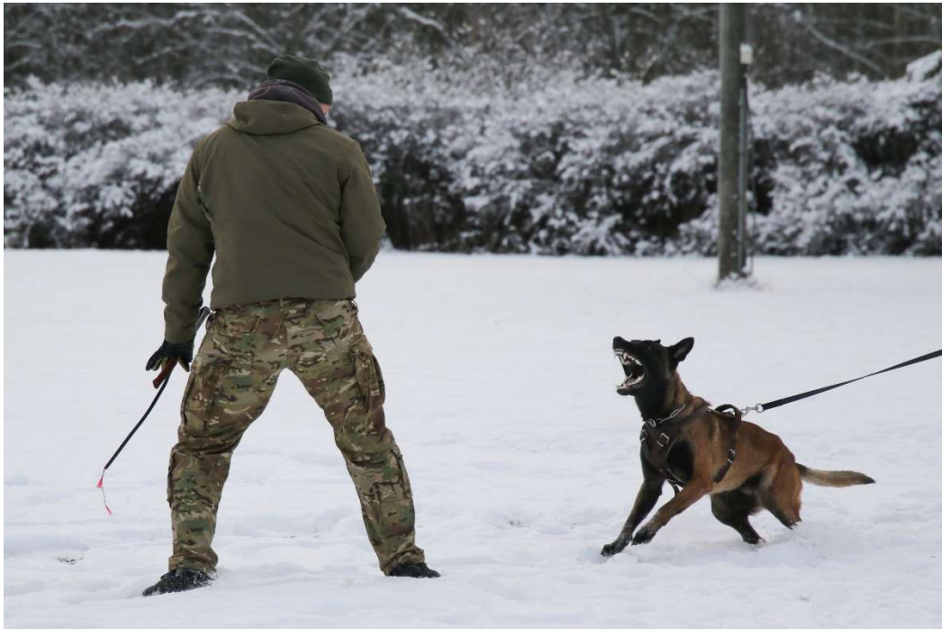
Kuva 3. Koiran aggressiokäyttäytyminen.

Puolustusvietti näkyy koiran aggressiivisena käyttäytymisenä (Mujunen 2009, 118). Kuvissa 2 ja 3 esimerkit koiran aggressiivisesta käyttäytymisestä. Aggressiivinen tai puolustuskannalla oleva koira on ryhdikkäästi ylhäällä, nojaa eteenpäin näyttääkseen suuremmalta ja nostaa niskakarvojaan pystyyn. Häntä on ylhäällä liikkumatta ja korvat ovat pystyssä osoittaen eteenpäin. Koira irstää kuono rypyssä ja saattaa paljastaa hampaansa. Koiralla on suora ja tiivis katsekontakti. (Hoffmann 1999, 54.) Aggressiivinen koira usein myös haukkuu tai murisee (Moore 2012, 178). Ennen puolustuskäyttäytymistä koira voi olla tarkkaavainen kohdetta kohti. Tarkkaavaisella koiralla ruumiinosat ovat ylhäällä ja nojaavat eteenpäin. Pää ja korvat ovat ylhäällä ja suuntaavat eteenpäin, pää voi myös nojata hieman eteenpäin. Katse on tarkkaavainen ja koira saattaa nostaa toista etutassuaan. (Hoffman 1999, 51.) Koiran häntä voi olla myös koholla (Kaimio 2007, 151).