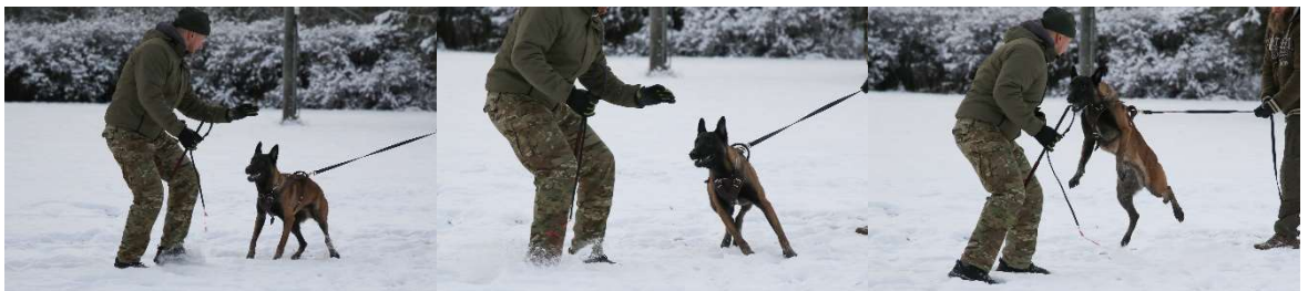
Kuva 1. Koiran saaliskäyttäytyminen.

”Ärsykespesifinen kylläntyminen. Kun petoeläimelle tarjotaan peräkkäin saaliseläintä toisensa jälkeen, niin se tappaa saaliin ensimmäisillä kerroilla, kunnes saaliseläin ei enää muutaman toiston jälkeen edusta riittävää käyttäytymistä laukaisevaa ärsykettä.” (Raiser 1984, s.25)