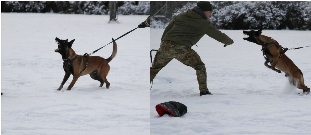
Kuva 2. Koiran aggressiokäyttäytyminen.

Mackenzie käsittelee koiran aggressiota kirjassaan K9 Decoys and aggression . Mackenzie kertoo, että monet maalimiehet ja koiranohjaajat käyttävät väärin termiä vietti. Vietin sijasta tulisi käyttää sanaa motivaatio. Aggressio on yksinkertaisesti käyttäytymistä, eikä sitä aja mitkään voimat tai vietit. Aggressioon, niin kuin moneen muuhun käyttäytymiseen vaikuttaa neljä päätekijää: geenit, kemia, varhaiskokemukset ja aikuisoppiminen. Käyttäytymistä, jota kontrolloi geenit, kutsutaan vaistoiksi tai vaistonvaraiseksi käyttäytymiseksi. Hyvänä esimerkkinä tässä on vastasyntynyt nisäkäs, joka alkaa itse imemään nisää. Vastasyntyneen ei tarvitse oppia tätä muualta, vaan se tapahtuu spontaanisti. Geenien takia eläin kokeilee tiettyä käytöstä ja sen käyttäytymisen seurauksia. Se opitaanko ja toistetaanko käytöstä, riippuu siitä, vapautuuko käytöksen johdosta dopamiinia. Eläimet kokevat dopamiinin vapautumisen palkitsevana ja niin viehättävänä, että ne yrittävät toistaa käytöstä joka siihen johti. (Mackenzie 2015, 43-56.)