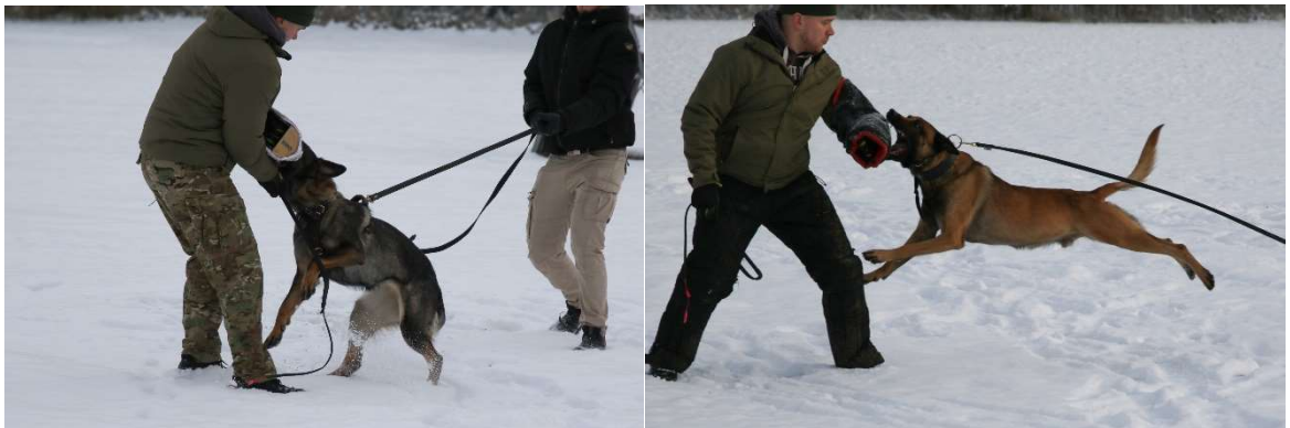
Kuva 4. Vasemmalla saksanpaimenkoira ja oikealla belgianpaimenkoira malinois.

Saksanpaimenkoirien jalostustavoitteena on kaksiviettisyys, eli saalisvietin ja puolustusvietin täydellinen tasapaino. Malinoisin viettirakenne poikkeaa saksanpaimenkoirasta siinä, että malinoisin voima tulee pääosin korostuneesta saalisvietistä. Malinoisin aggressio tulee usein saalisturhaumasta ja tämä on luonteeltaan hieman erilainen kuin puolustusvietin aggressio. (Mujunen 2009, 119.)