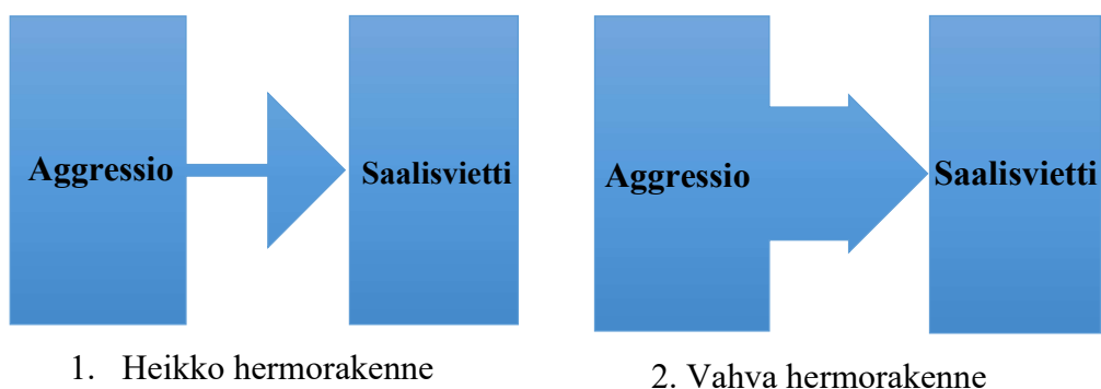
Kuvio 1. Koiran hermorakenteen merkitys kanavoinnissa.

Esimerkkinä koira, jolla on vahva hermorakenne, siirtää aggressiosta kumpuavan voiman ja energian suoraan saalisalueelle. Eli koira kanavoi aggressiosta saamansa voiman vahvaan ja rauhalliseen puruotteeseen. Heikon hermorakenteen omaava koira ei ehdi tai pysty siirtämään aggressiotaan saalisalueelle, jolloin koira puruotteessa vielä osittain aggression puolella ja tästä syystä koiran ote on rauhaton ja koira voi kuormittua puruotteessa. (Kokkonen Nd, 5.) Kuvio 1 havainnollistaa koiran kanavointia.