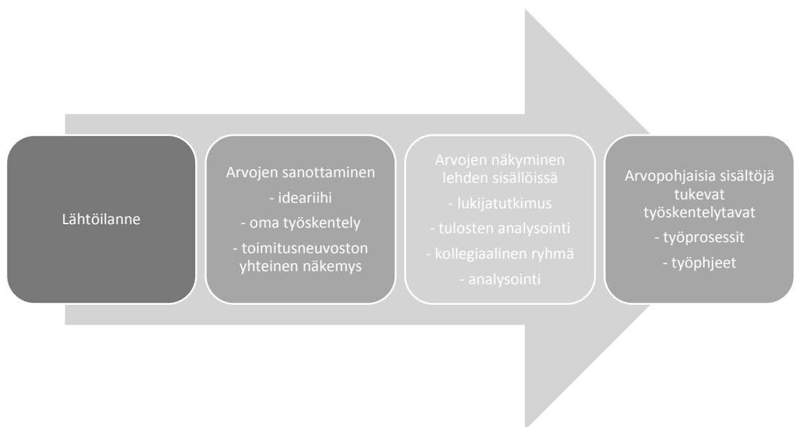
Kuvio 2. Kehittämistyön työprosessi

Tausta-aineistona analysointivaiheessa käytin edellisen lukijatutkimuksen tuloksia, vuoden 2018 lukijapalautteita sekä Ammattisotilas-verkkolehden kävijätilastoja.