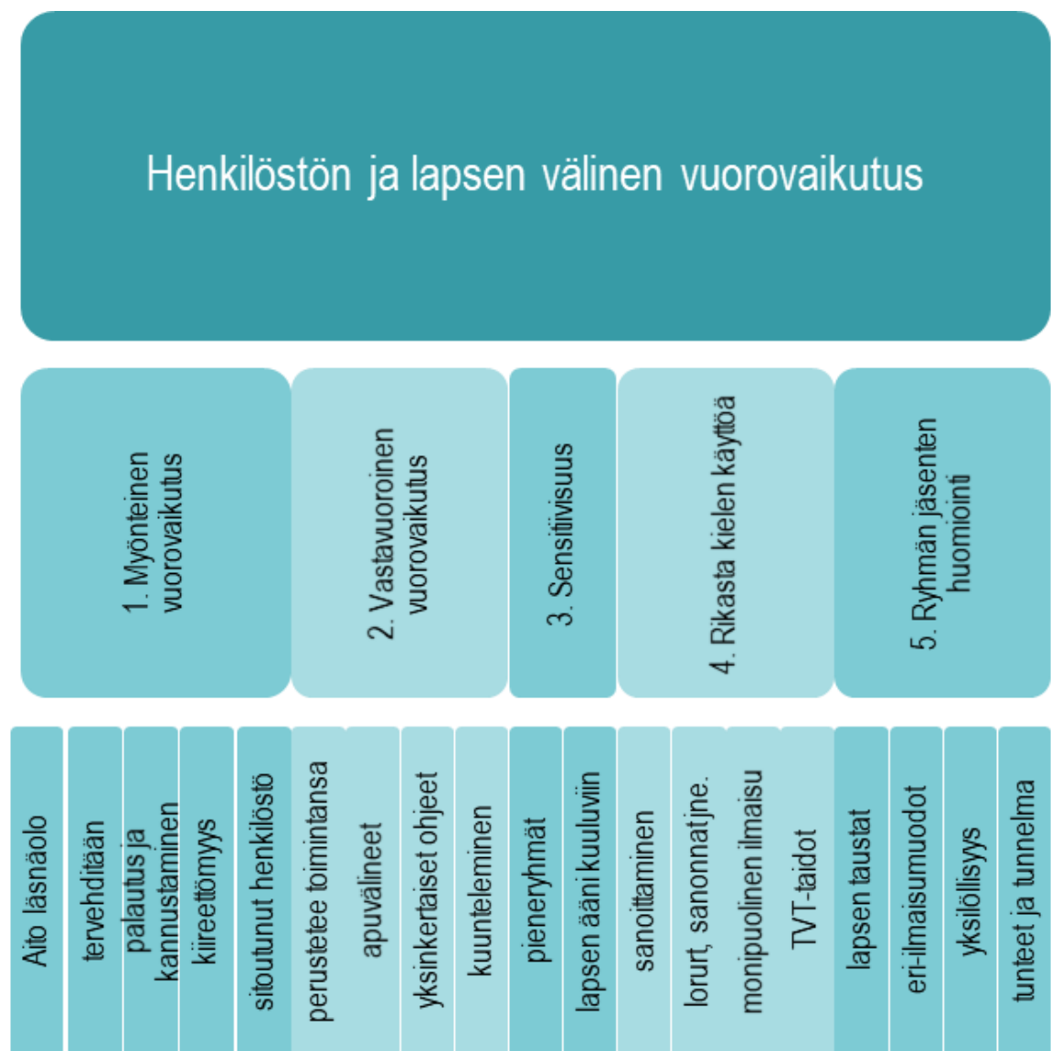
Kuvio 4. Indikaattorit ja kriteerit kiteytettynä.

Tässä luvussa luon kriteerit henkilöstön ja lapsen välisen vuorovaikutuksen viidelle indikaattorille. Indikaattori on yleinen käsite tai tavoitetila. Kriteerit ovat tarkempia yksityiskohtia, jota voidaan mitata tai havaita. Kriteerit ovat sovellettu suoraan kasvattajien ajatuksistaan. Kuviossa 4 näkyy kaikki viisi henkilöstön ja lapsen välisen vuorovaikutuksen indikaattoria ja niiden kriteerit kiteytettynä. Kunkin indikaattorin kohdalla on alaluku, jossa indikaattori ja siihen soveltuvat kriteerit ovat esitettynä kokonaisuudessaan.