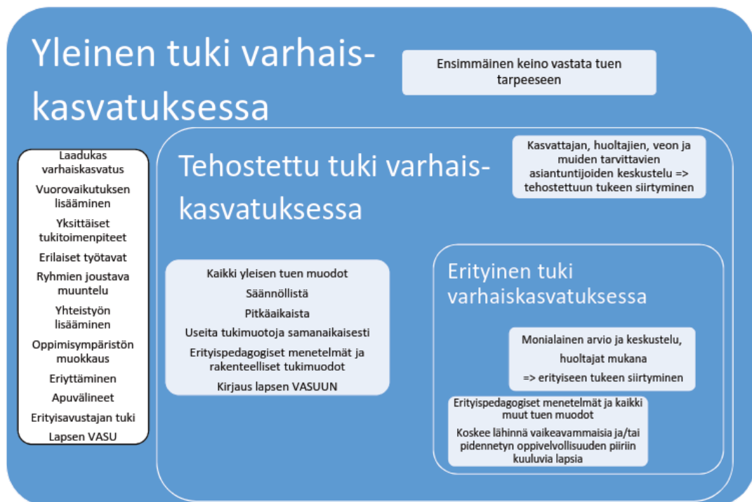
Kuvio 2. Kolmiportaisen tuen toteutuksen malli varhaiskasvatuksessa

Kuvio 2. Kolmiportainen tuki varhaiskasvatuksessa. Kolmiportaisen tuen toteuttamisen avulla pyritään turvaamaan jokaiselle lapselle parhaat mahdollisuudet kehitykseen ja oppimiseen. (Järvenpään kaupunki 2019.)