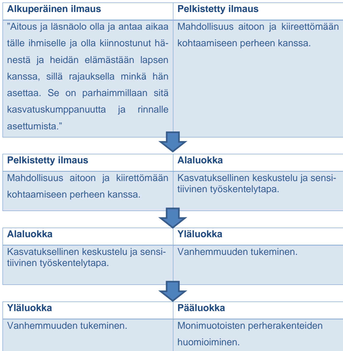
Kuvio 3. Esimerkki analyysistä.