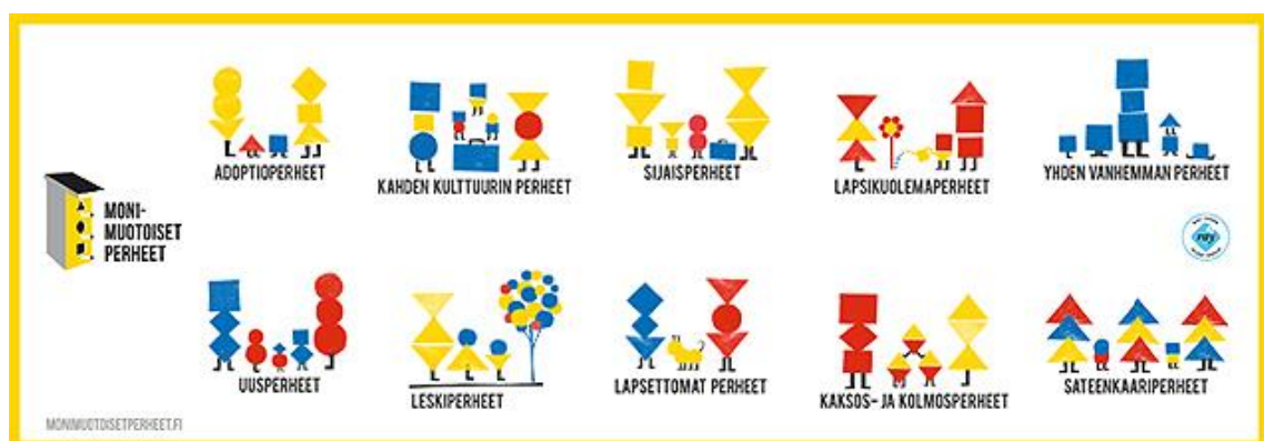
Kuvio 1. Monimuotoiset perheet (Monimuotoiset perheet 2019).

Perheiden moninaisuus on käsitteenä laaja ja termistöä käytetään vaihdellen. Alla olevassa kuvassa (kuvio 1) avataan mitä monimuotoiset perheet-käsitteenä sisältää. Tämä opinnäytetyö käsittelee yhden vanhemman perheiden lasten hyvinvoinnin tukemista, joihin myös leskiperheet sisältyvät.