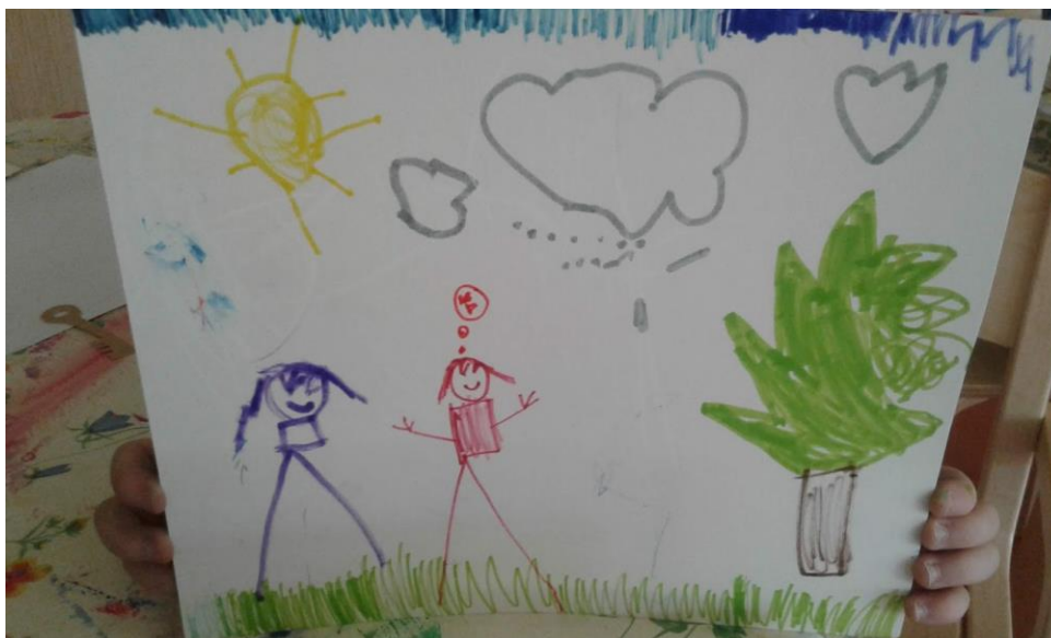
Äiti ajattelee kesää

Toiseen äitikuvaan lapsi oli piirtänyt äidin ja perheen koiran. Kuvassa siis esiintyy kaksi lapsen perheenjäsentä. Molemmat ovat kuvattu kuvaan suu-riksi hahmoiksi, vaikka todellisuudessa perheen koira on kohtalaisen pieni. Kuvasta ja tarinasta saakin käsityksen, että molemmat ovat lapselle tärkeitä. Haastattelijan kysyessä onko koira kiva, lapsi vastaa myöntävästi. Kuvan tausta on iloinen ja kesäinen. Kuvassa esiintyy taivas ja aurinko. Lapsi kertoo myös haastattelussa pikkuveljestä, joka aina kiusaa koiraa. Myös kolmas perheenjäsen on siis tarinassa läsnä, vaikkei häntä piirroksessa näykään.