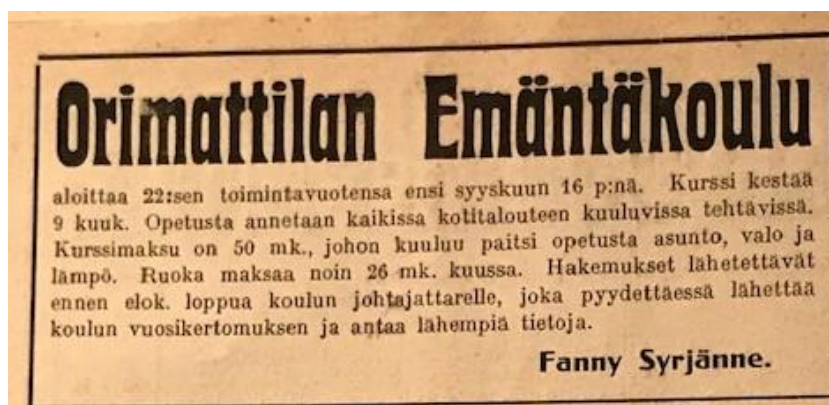
Kuva: Lehti-ilmoitus Suomen Nainen 1914 -lehdessä. Ilmoituksessa kerrotaan tietoa opiskelun kustan- nuksista Orimattilan emäntäkouluun periville.

oli 111. (mt., 35.) Koulun opetus ei ollut oppilaille ilmaista. Lukuvuonna 1910 – 1911 perittiin oppilailta maksua yhdeksältä kuukaudelta 45 markkaa ja niiltä oppilailta, jotka eivät asuneet koululla, 18 markkaa. Ruokamaksua perittiin kaikilta 18 markkaa kuukaudessa. (Vuosikertomus 1910-1911, Orimattilan emäntäkoulu., 8.) Kouluun ha- keutumisesta mainostettiin vuonna 1914 Suomen Nainen -lehdessä ja ilmoituksesta il- menee, että kurssimaksu ja ruoka olivat tuolloin jo hiukan kallistuneet. (Suomen Nai- nen 1914, 244.)