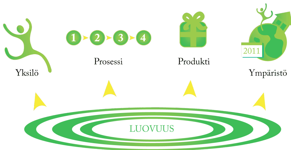
KUVIO 1. Luovuuden neljä peruselementtiä.

Professori Kari Uusikylän mukaan nykyisessä luovuustutkimuksessa luovuus jaetaan neljään elementtiin: (1.) yksilön eli persoonan piirteet, (2.) luova prosessi vaiheineen: ongelman havaitseminen, hautomisvaihe, oivallus sekä ratkaisun hyväksyminen tai hylkääminen, (3.) produkti eli luomisessa syntynyt tuote ja (4.) ympäristön vaikutus yksilön luovuuteen ja sen kehitykseen. (Uusikylä 1999, 56.) Helpottaakseni näiden neljän elementin hahmottamista olen tehnyt alla olevan kuvion (katso kuvio 1). Seuraavissa alaluvuissa käsittelen kolmea ensimmäistä luovuuden peruselementtiä: luovan yksilön piirteitä, luovaa prosessia ja sen ilmiöitä sekä luovuuden produktia.