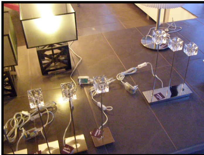
Hylätty kuva - Kaunis/Ruma

Valokuvaustyöskentelyssä kamera annetaan osallistujalle. Hän saa miettiä omaa tapaansa valita ja rajata kuvaa ja löytää kohteita, joita kuvaamalla ilmaista itselleen tärkeitä tai mielenkiintoisia asioita. Kuvaajalla on vapaus ottaa mieluisensa kuva haluamallaan tavalla. Kuvaustekniikka on toissijaista ja kehittyy jos työskentelystä tehdään pidempiaikainen prosessi. Tärkeintä on kuvaajan vapaus valita, rajata ja näyttää kuvillaan haluamiansa yksityiskohtia ja paloja lähiympäristöstään, elämästään ja itsestään.