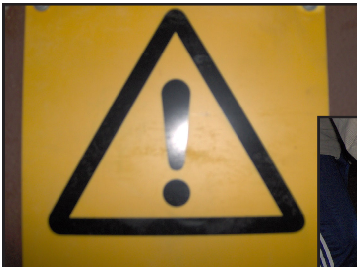
Fiilis - Viha

Nuorempien lasten kanssa teema voidaan ottaa jostakin ryhmälle ajankohtaisesta aiheesta tai käyttää muuten ikätasoon sopivia käsitteitä ja tehtäviä herättelemään kuvausintoa.