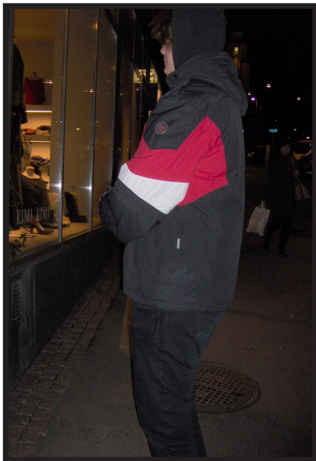
Fiilis - PA

Kuvaajille voi hankkia myös omat työvihkot tai kansiot, riippuen miten kuvia halutaan työstää ja miten ne halutaan tallentaa. Vihkoja voi käyttää porfolion tapaan, keräten niihin kuvia työskentelyn edetessä tai jopa päiväkirjamaisina muistivihkoina joihin kuvien lisäksi kuvaaja voi kirjoitella ja kirjata muitakin tunnelmiaan ja kokemuksiaan työskentelyn varrelta.