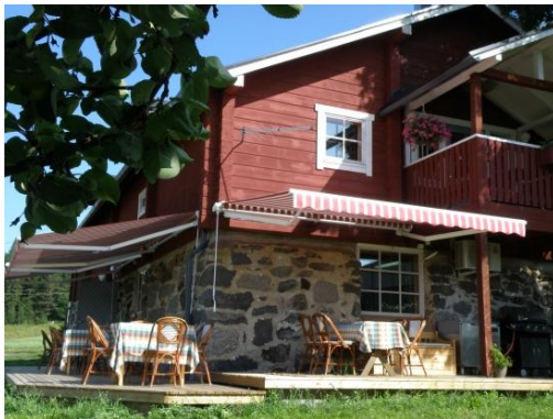
Kuva 1. Raijan Aitan kivinavetta ja kesäkahvila (Raijan Aitta 2011).

Kesäisin Raijan Aitta on avoinna vieraille joka päivä. Kivinavetan yläkerran myymälätila toimii kesäisin myös kahvilana (kuva 1) sekä yrityksen omien tuotteiden näyttelytilana ympäri vuoden. (Raijan Aitta 2011.)