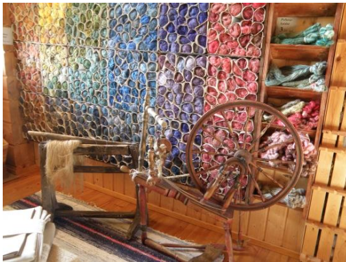
Kuva 3. Käsinvärjättyjä pellavakuituja. (Raijan Aitta 2011).

Raijan Aitan erityysoosaamiseen kuuluvat käsinkehrätyt ja -värjätyt pellavalangat ja -kuidut (Kuva 3). Näitä materiaaleja ostetaan esimerkiksi kudottujen käsitöiden efektilangoiksi (Liiketoimintasuunnitelma 2010, 5). Raijan Aitta myy myös erilaisia pellavakankaita myymälässään, messuilla ja verkkokaupassaan. (Raijan Aitta 2011.)