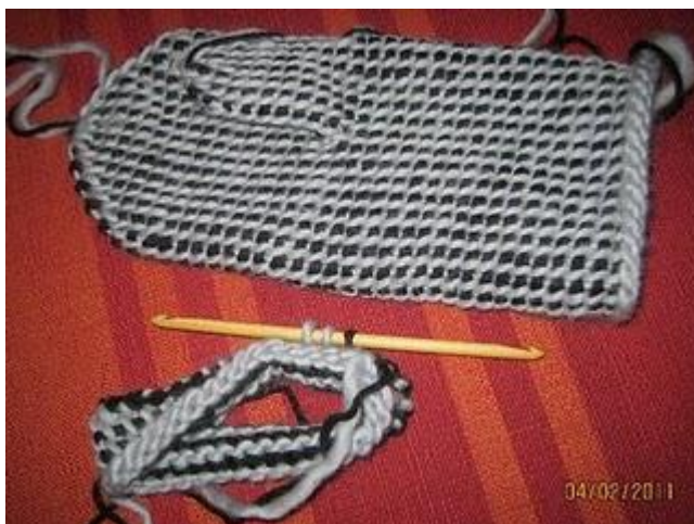
Kuva 8. Tunisialainen virkkaus (Sipin Silmukat).

Toinen Vanhakin nuortuu -käsityöretreitissä opetettava tekniikka on tunisialainen virkkaus (Liite 3.).