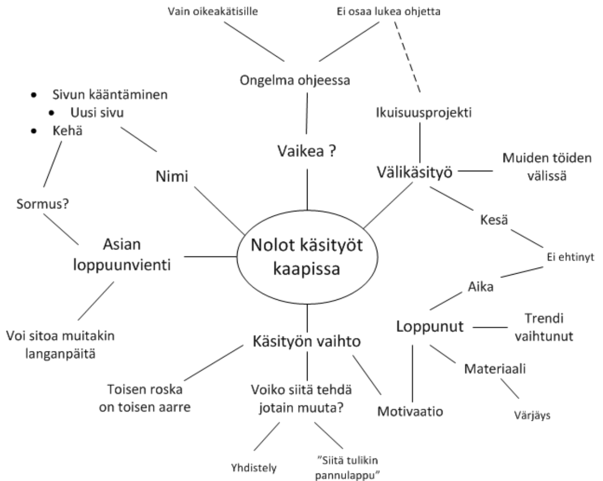
Kuvio 9. Miellekartta Elämänkehä-käsityöretreitistä

Ihmiset oppivat muilta ja joku toinen voi nähdä keskeneräisessä työssä jotain sel- laista, mitä ei ole tullut itse ajatelleeksi. Kierrätys ja ekologisuus ovat olleet nouse- via suuntauksia; epäonnistunutta työtä ei kannata heittää roskeen, vaan siitä voi tehdä jotain uutta ja kaunista.