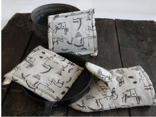
Kuva 2. Keittiötekstiilejä kalliomaalauskuosilla (Raijan aitta 2011).

Raijan Aitan erityysoosaamiseen kuuluvat käsinkehrätyt ja -värjätyt pellavalangat ja -kuidut (Kuva 3). Näitä materiaaleja ostetaan esimerkiksi kudottujen käsitöiden efektilangoiksi (Liiketoimintasuunnitelma 2010, 5). Raijan Aitta myy myös erilaisia pellavakankaita myymälässään, messuilla ja verkkokaupassaan. (Raijan Aitta 2011.)