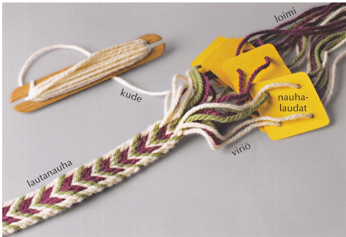
Kuva 7. Lautanauha, nauhalaudat ja kude (Karisto 2010, 10).

Lautanauhan kutomista varten luodaan loimi joka pujotetaan nauhalautojen reikiin. Kutominen tapahtuu avaamalla uusi viriö nauhalautanippua kääntäen. (Kuvio 7.)