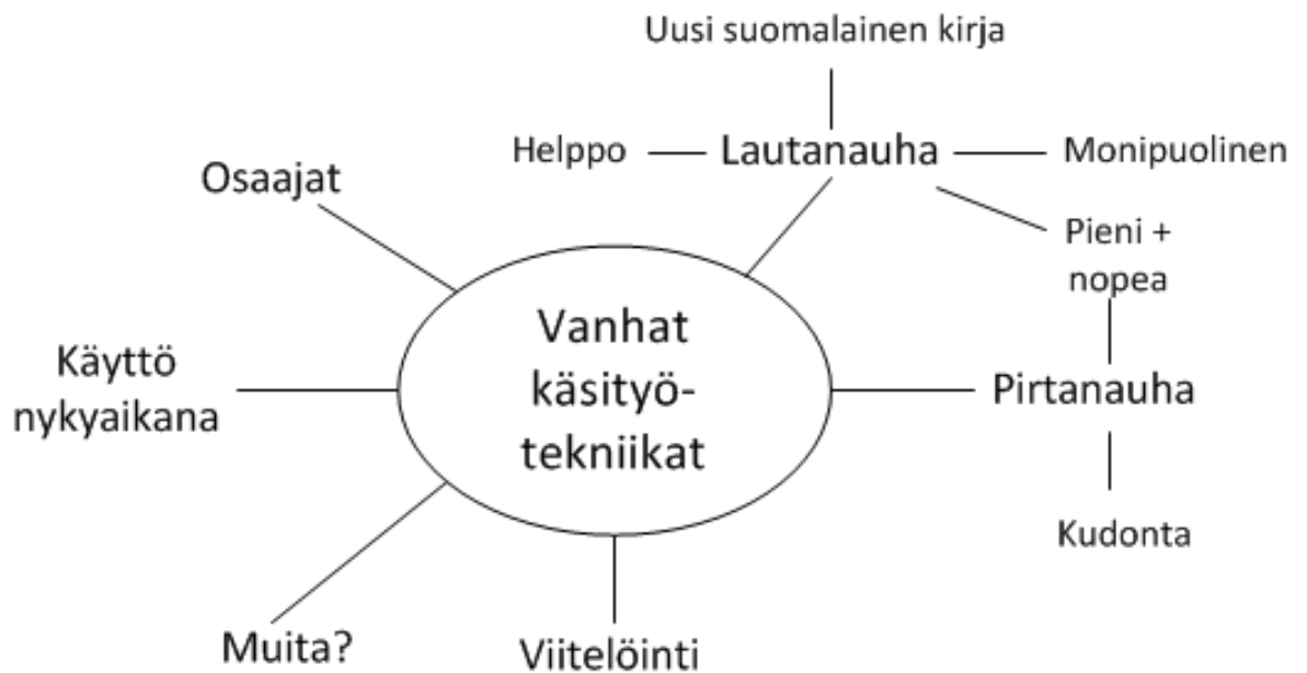
Kuvio 6. Miellekartta Vanhakin nuortuu -käsityöretiriitistä.

Vanhakin nuortuu -käsityöretiriitin teemana on vanhat käsityötekniikat (Kuvio 6.).