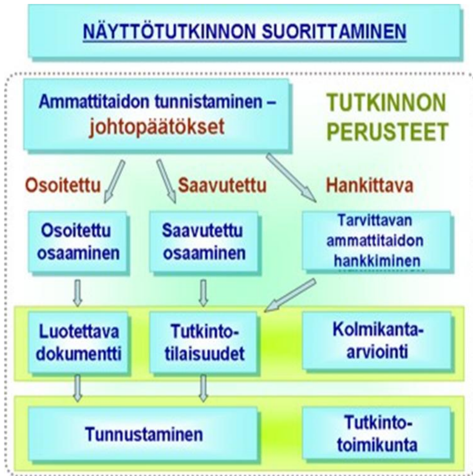
Kuva 1: näyttötutkinnon suorittaminen