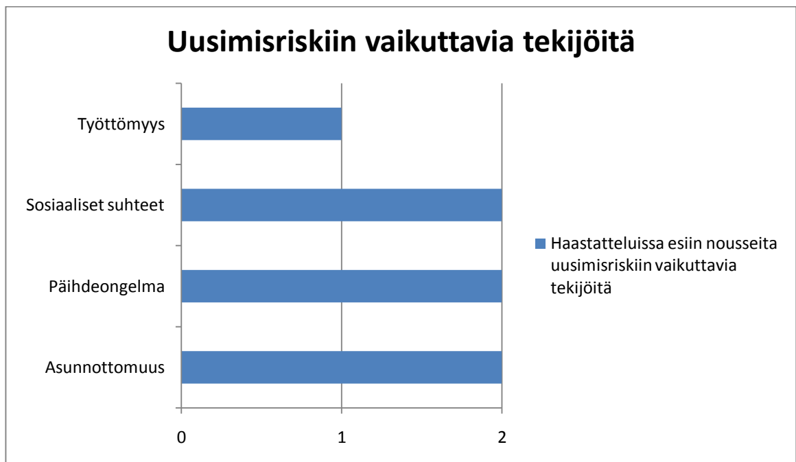
KUVIO 3. Uusimisriskiin vaikuttavia tekijöitä

Kysyttäessä muita uusimisriskiin vaikuttavia asioita, haastateltavat mainitsivat useita eri tekijöitä. Kaksi neljästä haastatellusta mainitsi asunnottomuuden, päihdeongelmat sekä sosiaaliset suhteet rikoksen uusimisriskiin vaikuttavia tekijöinä.