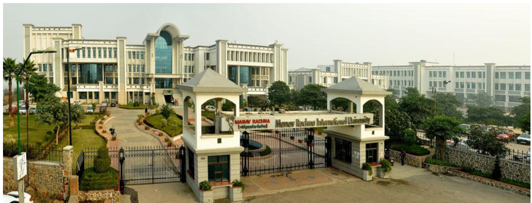
KUVA 1. Front of Manav Rachna International University (Manav Rachna International University, 2011)

Kuvasta 1 saa ensi näkemältä käsityksen, että infrastruktuuri on tosiaankin kunnossa. Kampus näyttää valtavalta, futuristiselta ja uudelta, mutta todellisuudessa on vaikea vetää mitään tarkkoja johtopäätöksiä pelkästään kuvan perusteella. Koulutusohjelmaa suunniteltaessa, Lamkista kävi kaksi ohjelmasta päävastuussa olevaa henkilöä tutustumassa MRIUn tiloihin. Todellisuudessa näin hienoksi jäi vain julkisivu. Rakennuksen takana on rakennustyömaa ja itse yliopisto on vielä pahasti rakennusvaiheessa. Opiskelija-asunnot on sisustettu huonosti ja asuinti-