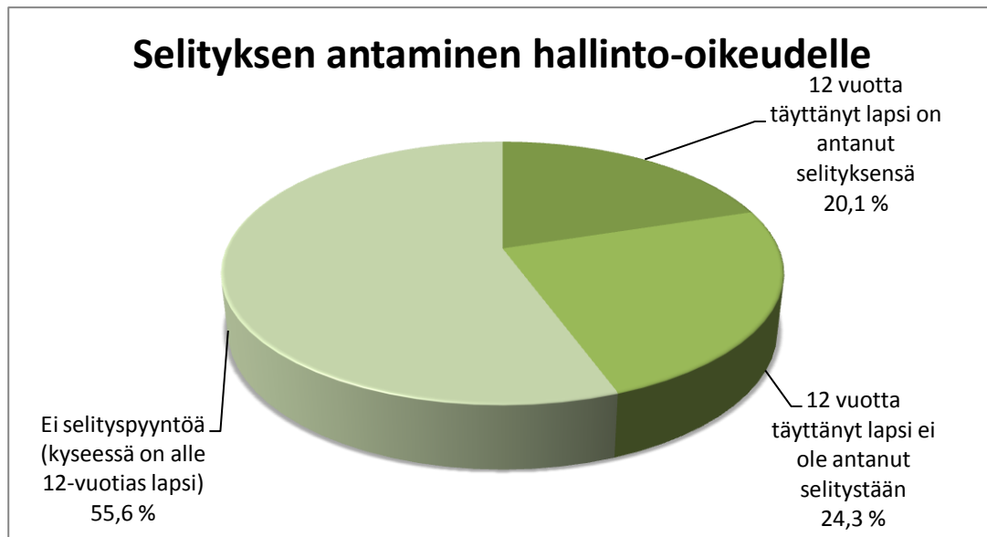
KUVIO 5. Selityksen antaminen.