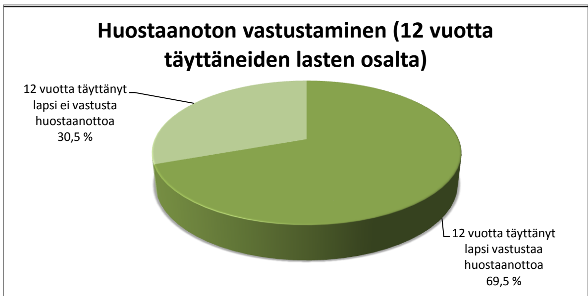
KUVIO 4. Huostaanoton vastustaminen 12 vuotta täyttäneiden lasten osalta.

Mikäli huostaanottoa vastustaa 12 vuotta täyttänyt lapsi tai hänen huoltajansa, on tällöin johtavan viranhaltijan tehtävä huostaanotosta hakemus hallinto-oikeudelle (LSL 9:44 §). Tutkimuksessa ilmeni, että 12 vuotta täyttänyt lapsi vastusti huostaanottoa 41:ssä tapauksessa. 18:ssa tapauksessa 12 vuotta täyttänyt lapsi ei sen sijaan vastustanut huostaanottoa. Tutkimuksen mukaan 84:ssä tapauksessa huostaanoton vastustaminen ei käy ilmi, sillä näiden osalta kyseessä on ollut alle 12-vuotias lapsi (kuvio 4).