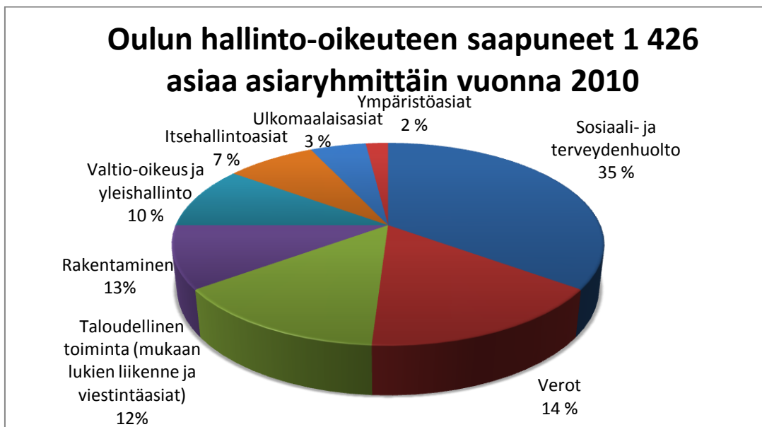
KUVIO 1: Oulun hallinto-oikeuteen saapuneet asiat asiaryhmittäin vuonna 2010.

Oulun hallinto-oikeuteen käsitteilyyn saapui vuonna 2010 yhteensä 1 426 uutta asiaa (kuvio 1), joka on 67 asiaa enemmän kuin edellisenä vuonna määrän ollessa 1 359. Asiat jakaantuvat yhdeksään pääasiaryhmään: valtio-oikeus ja yleishallinto, itsehallinto, ulkomaalaisasiat, rakentaminen, ympäristö, sosiaali- ja terveydenhuolto, taloudellinen toiminta mukaan lukien liikenne- ja viestintäasiat, verot sekä muut asiat. (Oikeuslaitos 2011b, hakupäivä 23.4.2011.)