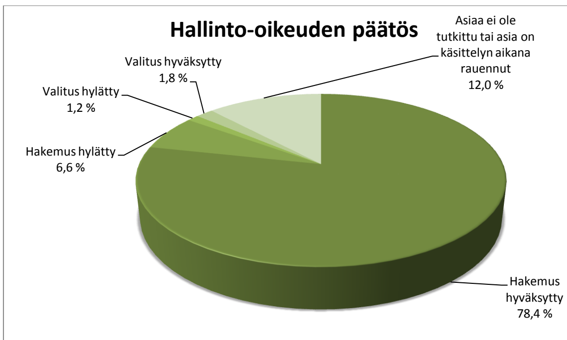
KUVIO 6. Hallinto-oikeuden päätös asiassa.