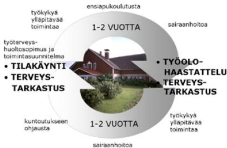
KUVIO 2. Maatalousyrittäjien työterveyshuollon toimintaperiaate (Tietokortti 12 2009)

Työterveyshuoltoon liittyminen on maatalousyrittäjille vapaaehtoista. Jokaisen työterveyshuoltoon liittyvän yrittäjän kanssa tehdään työterveyshuoltosopimus ja toimintasuunnitelma. Osa tilan laatu järjestelmää on työterveyshuollon palveluiden hyödyntäminen. Seuraavassa kuviossa on esitelty maatalousyrittäjien työterveyshuollon sisältöä prosessin muodossa (kuvio 2; Tietokortti 12 2009.)